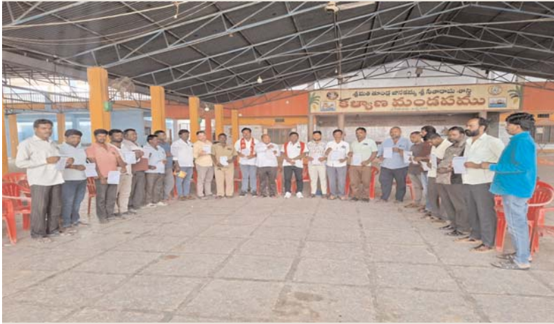
(హైదరాబాద్ ఎస్టేట్ ప్రతినిధి) ఫిబ్రవరి 4

4 లేబర్ కోడ్స్ రద్దు చేయాలి, రాష్ట్ర ప్రభుత్వం ఉచిత బస్సు తేవటం వల్ల ఆటో కార్మికులు నష్టపోతున్నారని కనుక ద్రైవర్లకు నెలకు 4500/ రూ” ఇవ్వాలి.