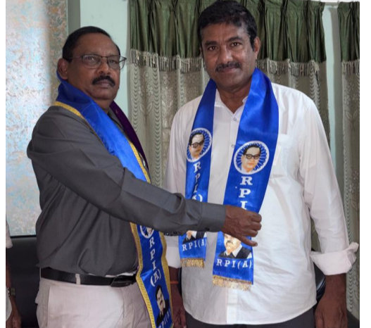
హైదరాబాద్ ఎస్టేట్ న్యూస్ ప్రతినంది కడియం ఫిబ్రవరి 13 రిపబ్లికన్ పార్టీ ఆఫ్ ఇండియా (అంబేద్కర్) రాష్ట్ర అధ్యక్షులు