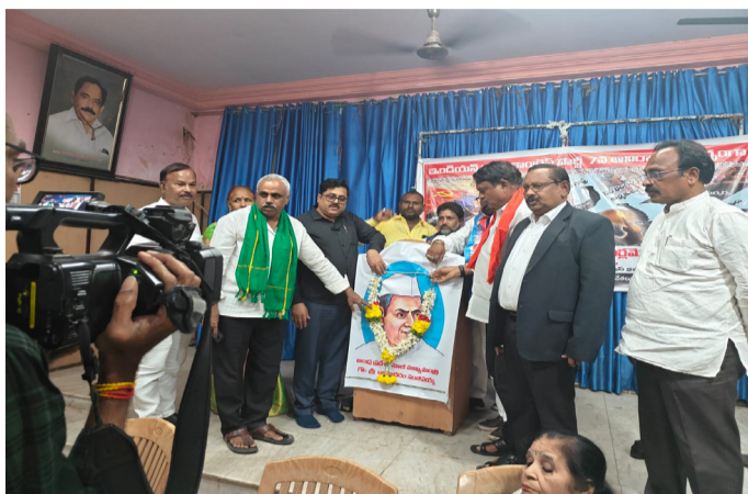
ఆర్థికంగా వెనుకబడుతున్నారని ఆవేదన వ్యక్తం చేశారు. కేంద్ర