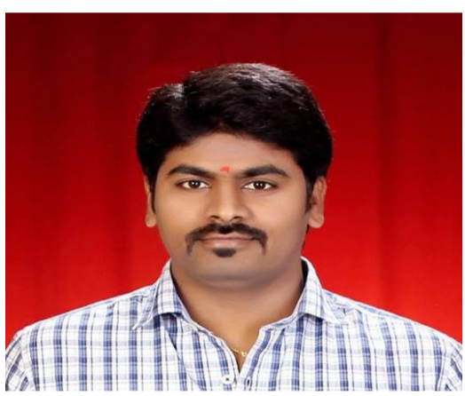
వంటి ఘటనలు చోటుచేసుకుంటున్నాయి. ఇటువంటి పరిస్థితుల్లో