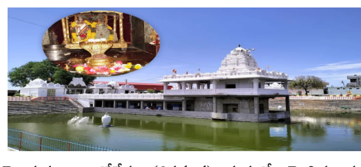
తెలుపుతున్నాయి. కోనేరు (శివగంగ) మధ్యలో వెలసిన ఈ ఆలయం ప్రత్యేకతను సంతరించుకుంది. భక్తులు కోనేరును దాటి స్వామివారి దర్శనం చేసుకోవడం ఈ క్షేత్ర ప్రత్యేక ఆకర్షణగా

శివగంగ రాజరాజేశ్వర స్వామి దేవస్థానంలో ఛత్రపతి శివాజీ విడిది చేసినట్లు చరిత్ర చెబుతోంది హైదరాబాద్ ఎస్టేట్ న్యూస్ మహేశ్వరం ప్రతినంది రంగారెడ్డి జిల్లా మహేశ్వరంలో కొలవై ఉన్న పురాతన మరియు ప్రసిద్ధ శివాలయం అయిన శివగంగ రాజరాజేశ్వర స్వామి దేవస్థానం ఆధ్యాత్మిక, చారిత్రక ప్రాధాన్యత కలిగిన క్షేత్రంగా ప్రసిద్ధి చెందింది. సుమారు 400 సంవత్సరాల క్రితం గోల్కొండ నవాబు తానీషా ఆస్థాన మంత్రులు అయిన అక్కన్న మరియు మాదన్న ఈ ఆలయాన్ని నిర్మించినట్లు చారిత్రక ఆధారాలు