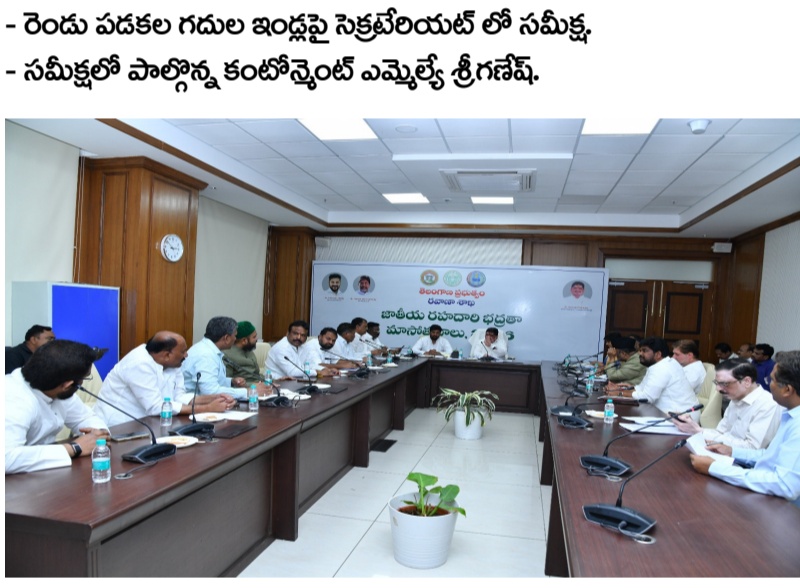
హైదరాబాద్ ఎస్టేట్ ప్రతినిధి ఫిబ్రవరి 18:-