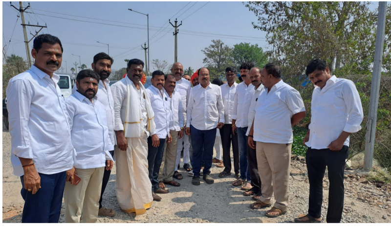
హైదరాబాద్ ఎస్టేట్ సూపర్ మహాత్మ్యం ప్రతినిధి

- రావిర్యాల - సూర్యగిరి ఎల్లమ్మ - సర్కార్ నగర్ రోడ్డుకు మహారాష్ట్ర కేఎల్ఆర్