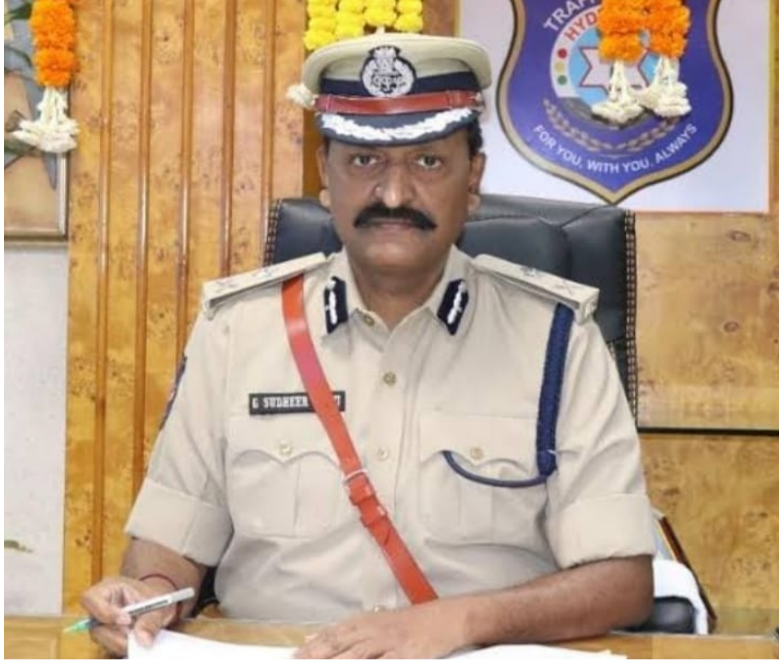
హైదరాబాద్ ఎస్టేట్ ప్రతినిధి ఫిబ్రవరి 18: