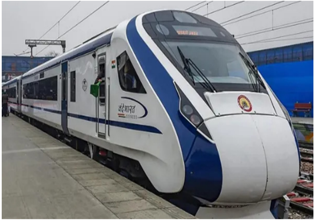
మరోవైపు దుర్గ నుంచి విశాఖకు వచ్చే మరోవందే భారత్ ఎక్స్ ప్రెస్ రైలు నంబర్ 20829 టైమింగ్ లోనూ మార్పు చేశారు.

అమరావతి : తెలుగు రాష్ట్రాల్లో ప్రస్తుతం నడుపుతున్న వందే భారత్ ఎక్స్ ప్రెస్ రైల్వే రాకపోకల్లో మార్పులు చోటు చేసుకుంటున్నాయి. ఇప్పటికే నడుస్తున్న రైల్వేలో పెరుగుతున్న రద్దీ, ప్రయాణికుల డిమాండ్, స్థానిక పరిస్థితుల ఆధారంగా ఈ మార్పులు చేస్తున్నారు. వందే భారత్ రైల్వేలో ప్రయాణించే వారు ఎప్పటికప్పుడు ఈ మార్పుల్ని తెలుసుకుని ప్రయాణాలు చేయాలని అధికారులు కోరుతున్నారు. ఇదే క్రమంలో తాజాగా విశాఖపట్నం స్టేషన్ కు వచ్చే ఓ వందే భారత్ ఎక్స్ ప్రెస్ రైలు టైమింగ్ లో స్వల్పమార్పు జరిగింది. ప్రస్తుతం సికింద్రాబాద్ నుంచి విశాఖపట్నానికి నడుపుతున్న వందే భారత్ ఎక్స్ ప్రెస్ రైలు నంబర్ 20707 టైమింగ్ లో తూర్పు కోస్తా రైల్వే స్వల్ప మార్పు చేపట్టింది. విశాఖపట్నం స్టేషన్ లో అంతంతకూ పెరిగిపోతున్న రైల్వే రద్దీని దృష్టిలో ఉంచుకుని ఈ మార్పు చేశారు. ఇప్పటివరకూ సికింద్రాబాద్ నుంచి విశాఖకు వస్తున్న వందే భారత్ ఎక్స్ ప్రెస్ రైలు మధ్యాహ్నం 1.45కు వస్తుండగా... దీన్ని కాస్తా మరో ఐదు నిమిషాల టైం పొడిగించి 1.50కు వచ్చేలా మార్పు చేశారు. ఈ మార్పు రేపటి నుంచి అమల్లోకి వస్తుందని తూర్పు కోస్తా రైల్వే ఓ ప్రకటన విడుదల చేసింది. ఇది మినహా సికింద్రాబాద్-విశాఖపట్నం వందే భారత్ ఎక్స్ ప్రెస్ రైలు రాకపోకల్లో ఎలాంటి మార్పులూ లేవు. ఇప్పటికే పూర్తి రద్దీతో నడుస్తున్న ఈ రైలులో ప్రయాణాలకు ముందస్తుగా బుకింగ్ చేసుకోవాల్సి వస్తోంది. చివరి నిమిషంలో ప్రయాణాలు చేయాలంటే ఇబ్బందులు తప్పదం లేదు. అయితే విశాఖ స్టేషన్లో ప్రస్తుతం చేసిన ఐదు నిమిషాల సమయం మార్పు ప్రభావం ప్రయాణికులపై అంతగా ఉండకపోవచ్చు. మరోవైపు విశాఖ స్టేషన్లో రద్దీ కాస్త తగ్గుతుంది.