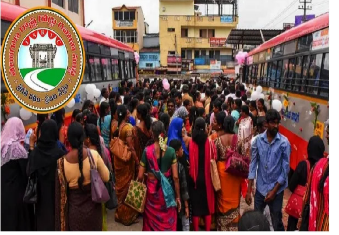
ఉంటుంది. వెనక భాగంలో ఉచిత బస్సు పథకానికి సంబంధించిన నియమ నిబంధనలు పొందుపరిచారు. రాష్ట్రవ్యాప్తంగా సుమారు 1.5 కోట్ల మందికి ఈ స్మార్ట్ కార్డులు జారీ అవ్వనున్నాయి. ఇందుకోసం సెంటర్ ఫర్ గుడ్ గవర్నెన్స్ తో కీలక ఒప్పందం చేసుకుంది. ఈ సంస్థ సహకారంతో ప్రతి మహిళకు ప్రత్యేక కార్డులు పంపిణీ చేయనున్నారు. ప్రభుత్వం తీసుకొచ్చే ఈ స్మార్ట్ కార్డు చూపించి మహిళలు ఇక్కడ ఆర్టీసీ బస్సుల్లో ప్రయాణం చేసే విధంగా నిర్ణయం తీసుకున్నారు. ప్రస్తుతం బెంగళూరు, ముంబయి, లక్నో నగరాల్లోని బస్సుల్లో స్మార్ట్ కార్డు విధానాల్లో ఎలాంటి ఫీచర్లు చేస్తున్నారు.