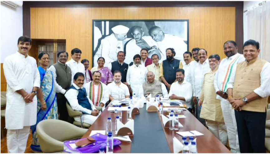
అజహరుద్దీన్, పొంగులేటి శ్రీనివాస్ రెడ్డి, సమావేశంలో తెలంగాణ ప్రభుత్వ రెండేళ్ల జూపర్ల కృష్ణారావు, సీతక్క, కొండా సురేఖ, పాలనపై ప్రోగ్రెస్ రిపోర్ట్, ఉత్తమ్ కుమార్ రెడ్డిలు పాల్గొన్నారు. ఈ మిగతా2లో...

న్యూఢిల్లీ, ఫిబ్రవరి 19 : సమానత్వంతో కూడిన తెలంగాణ నిర్మాణం కోసం కాంగ్రెస్ ప్రభుత్వం కట్టుబడి ఉందని, 'ప్రజల తెలంగాణ' లక్ష్యాన్ని సాధించే దిశగా కార్యాచరణను రూపొందించినట్లు ఏబీసీ అధ్యక్షుడు మల్లికార్జున ఖర్చే పేర్కొన్నారు. సామాజిక సంక్షేమం, ఆర్థిక సాధికారత, ప్రతి పౌరుడికి న్యాయం అందించడం తమ ప్రధాన సంకల్పమని ఆయన వెల్లడించారు. ఢిల్లీలోని మల్లికార్జున ఖర్చే నివాసంలో తెలంగాణ కాంగ్రెస్కు సంబంధించిన కీలక సమీక్ష సమావేశం జరిగింది. పార్టీ అగ్రనేత రాహుల్ గాంధీ కూడా పాల్గొన్నారు. ఈ సమావేశానికి ముఖ్యమంత్రి రేవంత్ రెడ్డి, డిప్యూటీ సీఎం భట్టి విక్రమార్కు పీసీసీ చీఫ్ మహేష్ కుమార్ గౌడ్ తో పాటు పలువురు మంత్రులు శ్రీధర్ బాబు, కోమటి రెడ్డి వెంకట రెడ్డి, దామోదర రాజనర్సింహు, అడ్డూరి లక్ష్మణ్,