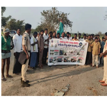
అత్యధికారి.ఎస్. ఫిబ్రవరి 26 : ముందస్తు జాగ్రత్తలు పాటించడంతోనే రోడ్డు ప్రమాదాల నుండి రక్షణ పొందవచ్చు అని అత్యధికారి.ఎస్ ఎస్బి బి.శ్రీకాంత్ గౌడ్ అన్నారు. ఆరెమ్ ఆరెమ్ రోడ్డు భద్రతలో భాగంగా గురువారం మండల వ్యాప్తంగా అవగాహన కార్యక్రమాల నిర్వహించి రోడ్డు నియమాల పట్ల ప్రజలకు సూచనలు చేశారు. అధిక వేగం, మధ్యం మత్తులో, తప్పుడు మార్గంలో వాహనాలు నడపవద్దన్నారు. మైనర్లకు వాహనాలు ఇవ్వకూడదన్నారు. ద్విచక్ర వాహనంపై ప్రయాణించేవారు తప్పక హెల్మెట్ ధరించాలన్నారు. వాహన పరిమితికి మించి ప్రయాణికులను, పస్తులను రవాణా చేయకూడదని, రవాణాలపై ఎక్కువపడితే అక్కడ వాహనాలు నిలవరాదని ఎస్బి పేర్కొన్నారు.