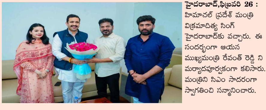
హైదరాబాద్, ఫిబ్రవరి 26 : హిమాచల్ ప్రదేశ్ మంత్రి విక్రమాదిత్య సింగ్ హైదరాబాద్ కు వచ్చారు. ఈ సందర్భంగా ఆయన ముఖ్యమంత్రి రేవంత్ రెడ్డి ని మర్యాదపూర్వకంగా కలిసారు. మంత్రిని సిఎం సాదరంగా స్వాగతించి సన్మానించారు.