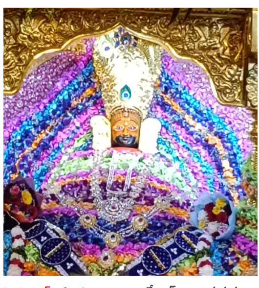
హైదరాబాద్, ఫిబ్రవరి 27: రాధేశ్యామ్ నామస్మరణలు