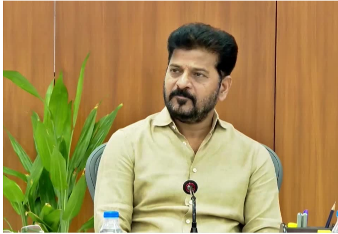
భాగంగా, 4 డ్రాస్టో దాడి చేసినట్లు టెక్నోసెల్లెట్లో చెప్పింది. ఇరాన్, గల్ఫ్ ప్రాంతాల్లో ఉన్న తెలుగు ప్రజలందరూ అప్రమత్తంగా ఉండాలని సీఎం రేవంత్ ఆయా దేశాల్లోని భారత

హైదరాబాద్ : పశ్చిమాసియా దేశాల్లో నెలకొన్న ఉద్రిక్త పరిస్థితుల్లో ఇరాన్, ఇజ్రాయెల్ ప్రాంతాల్లో ఉన్న తెలుగు ప్రజలందరూ అప్రమత్తంగా ఉండాలని సీఎం రేవంత్ రెడ్డి ఆకాంక్షించారు. భద్రతా మార్గదర్శకాలను పాటించాలని అక్కడి తెలుగు ప్రజలను కోరారు. ప్రతి ఒక్కరూ సురక్షితంగా ఉండాలి : ఆయా దేశాల్లోని భారత రాయబార కార్యాలయాలు జారీ చేసే సూచనలు పాటించాలని రేవంత్ రెడ్డి తెలిపారు. అత్యవసర పరిస్థితి ఎదురైతే తప్ప తెలుగు ప్రజలు ఎవరూ బయటకు రావద్దని సూచించారు. తెలుగువారిని రప్పించేందుకు కేంద్రంతో రాష్ట్రం సమన్వయం చేసుకుంటుందన్న ఆయన ఇరాన్, గల్ఫ్ దేశాల్లోని రాష్ట్రప్రజల పరిస్థితిని ప్రభుత్వం నిరంతరం పరిశీలిస్తుందని పేర్కొన్నారు. ఇరాన్ సుప్రీం లీడర్ ఖమేనీ మృతి చెందిన నేపథ్యంలో అదేశం ప్రతీకార దాడులకు దిగింది. తాజాగా పశ్చిమాసియాలోని 27 అమెరికా సైనిక స్థావరాలే లక్ష్యంగా డ్రాస్టో, క్షిప్రణులతో దాడులు చేస్తోంది. వీటిలో ఇజ్రాయెల్లోని బెల్ నోవ్ ఎయిర్ బేస్, ఇజ్రాయెల్ ఆర్మీ ప్రధాన కార్యాలయం హాకిర్యాలతోపాటు రక్షణ రంగ ఫ్యాక్టరీలు కూడా ఉండడం గమనార్హం. అంతేకాదు అమెరికా నౌకలకు మందుగుండు సరఫరా చేసే ఎంఎస్ డి షిప్పై 'అవరేషన్ ట్రూ ప్రామిస్'లో