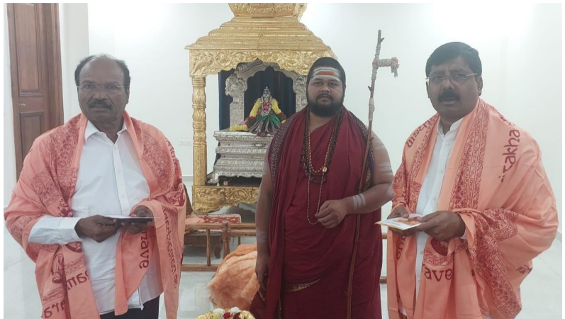
హైదరాబాద్ ఎస్టేట్ న్యూస్ మహేశ్వరం ప్రతినిధి

- భూములు కేటాయింపు కొనసాగింపు - సీఎం రేవంత్ రెడ్డి ఆదేశాలను వివరించిన నేతలు