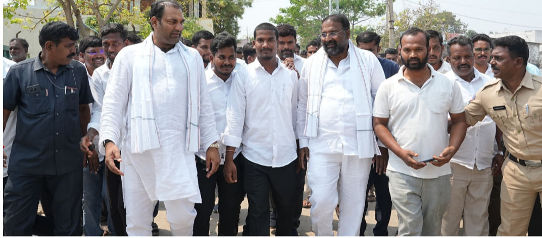
త్వరోనే జడ్పర్లలో ఇంటిగ్రేటెడ్ సూల్ ప్రారంభం కానుందని తెలిపారు. ముఖ్యమంత్రి రేవంత్ రెడ్డి చొరవతో జడ్పర్లలో ట్రిపుల్ గ్రామస్థులు పాల్గొన్నారు.