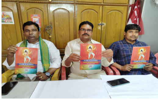
పిలుపునిచ్చారు. భారత రాజ్యాంగ నిర్ణాత దాక్టర్ బి.ఆర్ అంబేద్కర్ చెప్పిన విధంగా విద్యతోనే అసాధ్యాన్ని సుసాధ్యం చేయవచ్చని, ఉన్నత చదువుల ద్వారానే సమాజంలో

హైదరాబాద్ ఎస్టేట్ న్యూస్ ప్రతినిధి చిలకలూరిపేట :పదో తరగతి వార్షిక పరీక్షల సేవధ్యంలో విద్యార్థులందరూ ఆత్మవిశ్వాసంతో పరీక్షలు రాసి విజయం సాధించాలని గిరిజన సంఘాల నాయకులు పేర్కొన్నారు. విద్యార్థిని, విద్యార్థులకు శుభాకాంక్షలు తెలియజేశారు. సరాఫపేట సిపిఐ కార్యాలయంలో మాట్లాడుతూ కార్యాలయంలో నాయకులు మాట్లాడుతూ పది పరీక్షలు అనేవి విద్యార్థి జీవితంలో ఒక కీలకమైన మలుపు, ప్రతి విద్యార్థి క్రమశిక్షణతో చదువుకుని, తాము చదువుకున్న పాఠశాలకు, పుణ్య గర్వకు, ముఖ్యంగా కన్న తల్లిదండ్రులకు గర్వకారణంగా నిలవాలని ఆకాంక్షించారు. ప్రశాంతమైన మనస్తో పరీక్షలు రాసి, జిల్లాలోనే కాకుండా రాష్ట్రస్థాయిలో ఉత్తమ మార్కులు సాధించి పద్మావి జిల్లా ఖ్యాతిని చాటిచెప్పాలని