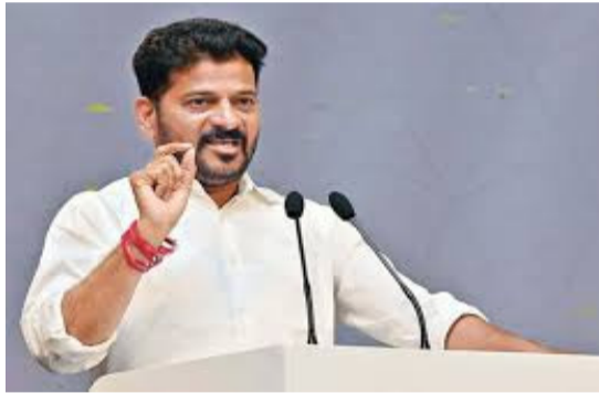
మైనార్టీలకు సింహ భాగం ఇస్తున్నాం. అంతా కలిసి మెలిసి దేశాన్ని ముందుకు తీసుకుపోవాలి. వైఎస్ హయాంలో మైనార్టీలకు 4 శాతం రిజర్వేషన్లు కల్పించారు. రిజర్వేషన్లు వల్ల

హైదరాబాద్, మార్చి 15: రంజాన్ కేవలం ఏండుగ మాత్రమే కాదని, ఆత్మశుద్ధి చేసుకునే సమయమని తెలంగాణ ముఖ్యమంత్రి రేవంత్ రెడ్డి అన్నారు. ప్రభుత్వం తరఫున ఇష్టానుకూల విధులు చేసినందుకు సంతోషంగా ఉందని అన్నారు. ప్రభుత్వం ముస్లింలకు అత్యంత ప్రాధాన్యత ఇస్తుందని చెప్పారు. కొందరు మతాల మధ్య చిచ్చు పెట్టడానికి ప్రయత్నిస్తున్నారంటూ అగ్రహం వ్యక్తం చేశారు. ఆయన తన ప్రసంగాన్ని కొనసాగిస్తూ.. 'అజరుద్దీన్ కు మంత్రి పదవి ఇచ్చాం. క్రికెటర్ సిరాజ్ కు డీఎస్సీ ఉద్యోగం ఇచ్చాం. బాక్సర్ నిక్కిట్ జరిసీ కు 2 కోట్ల రూపాయలు ఇచ్చి ప్రోత్సహించాము. ప్రతి ప్రభుత్వ కార్యక్రమంలో