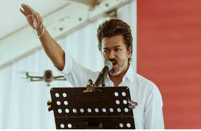
వైపు నుంచి ఎలాంటి స్పష్టతా లేదు. తమిళనాడులో విజయ్ కు విడుదల కానుంది.

చెన్నై: తమిళనాడులో రాజకీయం ఆసక్తికరంగా మారతోంది. కొత్తగా టీవీకే పార్టీ పెట్టిన స్టార్ హీరో విజయ్ కు డిప్యూటీ సీఎం పదవిని బీజేపీ ఆఫర్ చేసినట్లు సమాచారం. అలాగే ఈ అసెంబ్లీ ఎన్నికల్లో టీవీకేకు 80 సీట్లు ఇచ్చేందుకు బీజేపీ ప్రతిపాదించినట్లు తెలుస్తోంది. ఇరుపార్టీలకు సంబంధించిన విశ్లేషణలు వర్గాల సమాచారం ప్రకారం... బీజేపీ, టీవీకే పార్టీల మధ్య పొత్తుల విషయంపై చర్చలు జరుగుతున్నాయి. ప్రస్తుతం ఈ చర్చలు తుది దశలో ఉన్నాయి. బీజేపీ, టీవీకే కలిస్తే ఎన్.డి.యే కూటమిగా తమిళనాడులో పోటీ చేస్తారు. ప్రస్తుతం ఉన్న ప్రతిపాదనల ప్రకారం టీవీకేకు 80 సీట్లు ఇచ్చేందుకు బీజేపీ సిద్ధమైంది. అలాగే విజయ్ కు డిప్యూటీ సీఎం పదవిని కూడా ఇస్తామన్నారు. కానీ, విజయ్ మాత్రం ముఖ్యమంత్రి పీఠంపై గురి పెట్టారు. ఇదే ఈ చర్చల్లో కీలకంగా మారింది. మరోవైపు ఈ చర్చలకు ఏపీ డిప్యూటీ సీఎం పవన్ కల్యాణ్ చొరవ తీసుకున్నారనే ప్రచారం జరిగింది. కానీ, ఈ అంశంలో పవన్