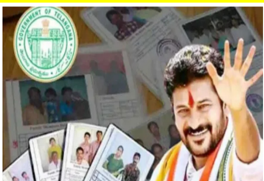
పథకాన్ని లాంఛనంగా ప్రారంభించుతున్నారు. రేషన్ కార్డులో ఉన్న కుటుంబ సభ్యులకు 5లక్షల జీవిత బీమా ఈ పథకం కింద రాష్ట్రంలోని ప్రతి రేషన్ కార్డుదారులకు, రేషన్

హైదరాబాద్ : తెలంగాణ ప్రభుత్వం మరో సూతన పథకానికి శ్రీకారం చుట్టింది. ఇప్పటికే తెలంగాణ రాష్ట్రంలోని అన్ని వర్గాల సంక్షేమం కోసం విస్తృతమైన పథకాలను తీసుకువచ్చి అందిస్తున్న తెలంగాణ ప్రభుత్వం తాజాగా 'ఇందిరమ్మ కుటుంబ జీవిత బీమా' పేరుతో రేషన్ కార్డులు ఉన్న ప్రతి కుటుంబానికి జీవిత బీమాను అందించనుంది. ఇటీవల రాష్ట్ర డిప్యూటీ సీఎం భట్టి విక్రమార్కు ఈ పథకంపై బడ్జెట్ ప్రసంగంలో ప్రకటన చేశారు. ఇందిరమ్మ కుటుంబ జీవిత బీమా పథకం తెలంగాణ డిప్యూటీ సీఎం, ఆర్థిక శాఖ మంత్రి మల్లు భట్టి విక్రమార్కు ఇటీవల అసెంబ్లీలో 2026-27 వార్షిక బడ్జెట్ను పేర్కొన్నారు. రూ. 3,24,234 కోట్ల అంచనాలతో ప్రవేశపెట్టిన ఈ బడ్జెట్లో, రాబోయే ఆర్థిక సంవత్సరంలో అమలు చేయనున్న పలు కొత్త పథకాలను ఆయన ప్రకటించారు. వాటిలో 'ఇందిరమ్మ కుటుంబ జీవిత బీమా పథకం' ఒకటి. ఆవిర్భావ దినోత్సవం జూన్ 2వ తేదీన ఇందిరమ్మ కుటుంబ జీవిత బీమా