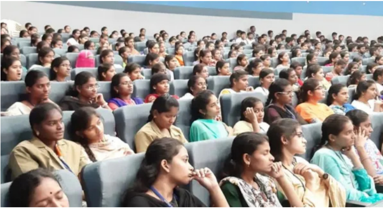
ధోరణి మారుతున్న తీరును స్పష్టంగా చూపిస్తున్నాయి. చిన్న కుటుంబాలు కనే గణాంకాలు పిల్లలను కనే విషయంలో యువత ఆలోచనాధోరణి మారుతున్న తీరును స్పష్టంగా చూపిస్తున్నాయి. చిన్న కుటుంబాల వైపు నేటి యువత మొగ్గు చూపుతోంది. ఇక ఈ మధ్య ఎక్కువైపోయారు.

ప్రస్తుతం ప్రపంచంలో చదువు, కెరీర్ అన్నింటా వచ్చిన మార్పులు, యువతపై పెరిగిపోయిన విపరీతమైన ఒత్తిడి, యువత పెళ్లి పట్ల అనాసక్తి చూపడానికి ప్రధానమైన కారణంగా చెప్పవచ్చు. ఆంధ్రప్రదేశ్ రాష్ట్రంలో సంఠానం విషయంలో గణాంకాలను చూస్తే రాష్ట్రంలో ఒక్క బిడ్డ మాత్రమే ఉన్న దంపతులు 47.92 శాతం వరకు ఉన్నారు. ఇద్దరు పిల్లలు ఉన్నవారు 44.16%, ముగ్గురు సంఠానం ఉన్నవారు 7.18 శాతం ఉన్నారు. ఇక నలుగురు సంఠానం ఉన్నవారు 0.67%, ఐదుగురు సంఠానం ఉన్నవారు 0.07 శాతం, ఆరుగురు సంఠానం అంతకంటే ఎక్కువ ఉన్నవారు 0.01 శాతం వరకు ఉన్నారు. పిల్లలను కనే విషయంలోనూ మారుతున్న యువత ఆలోచనా తీరు ఈ గణాంకాలు పిల్లలను కనే విషయంలో యువత ఆలోచన