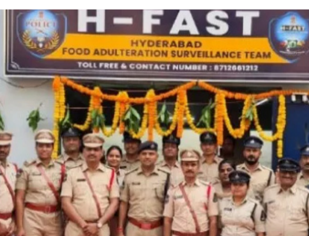
చేశారు. సనత్ నగర్లో టీ పొడిలో డస్ట్, కోకో పీల్, కృత్రిమ పట్టుకున్నారు. నగరవాసుల ఆరోగ్యాన్ని కాపాడేందుకు రంగులను కలిపి విక్రమిస్తున్న ముతాను హైదరాబాద్ పోలీసులు ఈ ప్రత్యేక బృందాన్ని ఏర్పాటు చేశారు.