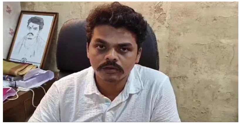
ఖాతా నుంచి నగదు ద్రా అయినట్లు మెసేజ్ రావడంతో షాక్ కు గురైన ఎమ్మెల్యే బాలరాజు వెంటనే అప్రమత్తమయ్యారు. ఆయన జీలుగువిల్లి పోలీస్ స్టేషన్లో ఈ ఘటనపై ఫిర్యాదు చేశారు. ఎమ్మెల్యే ఫిర్యాదు మేరకు కేసు నమోదు చేసుకున్న పోలీసులు, సైబర్ నేరగాళ్ల కోసం గాలింపు చర్యలు చేపట్టారు. ఐపీ అడ్డన్ ట్రాకింగ్ వంటి సాంకేతిక పద్ధతుల ద్వారా నిందితులను పట్టుకునేందుకు ప్రయత్నిస్తున్నట్లు పోలీసులు వెల్లడించారు.

ఏలూరు జిల్లా సైబర్ నేరగాళ్లు సామాన్యులతోపాటు వ్యాపారులు, ఉన్నతాధికారులు, ప్రజాప్రతినిధులను కూడా లక్ష్యంగా చేసుకుంటున్నారు. తాజాగా ఏలూరు జిల్లా పోలవరం నియోజకవర్గ ఎమ్మెల్యే జనసేన నేత చిల్ల బాలరాజుకు టోకరా ఇచ్చారు. ఆయన బ్యాంకు ఖాతా నుంచి భారీ మొత్తంలో నగదును కాజేశారు. ఈ ఘటనపై ఆయన పోలీసులకు ఫిర్యాదు చేయగా అధికారులు కేసు నమోదు చేసి దర్యాప్తు చేపట్టారు. ఎమ్మెల్యే బాలరాజు మొబైల్ ఫోన్ లోకి చలానా చెల్లించాలంటూ ఓ మేనేజ్ రావడంతో అందులో ఉన్న లింక్ ను ఆయన నిజమైనదని భావింపి క్లిక్ చేశారు. ఆ లింక్ ద్వారా ఆయన ఫోన్లో ఓ మాల్వేర్ యాప్ ఇన్స్టాల్ అయింది. అది క్లిక్ చేసిన క్షణం నుండి జనసేన ఎమ్మెల్యే బాలరాజు ఖాతా నుంచి గాఢంగా నగదు లూటీ అయింది. అది క్లిక్ చేసిన క్షణం నుండి జనసేన ఎమ్మెల్యే బాలరాజు ఖాతా నుంచి గాఢంగా నగదు లూటీ అయింది. అది క్లిక్ చేసిన క్షణం నుండి జనసేన ఎమ్మెల్యే బాలరాజు ఖాతా నుంచి గాఢంగా నగదు లూటీ అయింది.