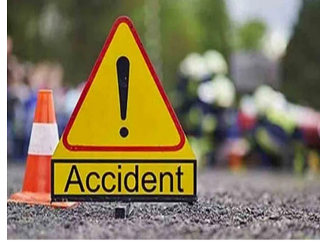
అమరావతి : ఏపీలోని తూర్పు గోదావరి జిల్లాలో ఘోర రోడ్డు ప్రమాదం చోటు చేసుకుంది. రెండు కార్లు ఢీ కొనడంతో

ముగ్గురు దుర్మరణం చెందారు. నలుగురు గాయపడ్డారు. ఈ విషాదకర సంఘటన దేవరపల్లి మండలం యర్ల గూడెం వద్ద గల జాతీయ రహదారిపై జరిగింది. వివరాలానికి వెళ్తే.. రాజమండ్రి-వైపు నుంచి విజయవాడ వెళ్తున్న కారు ఎదురుగా వస్తున్న మరో కారును ఢీ కొట్టడంతో ఈ ప్రమాదం జరిగింది. గమనించిన స్థానికులు పోలీసులకు సమాచారమిచ్చి క్షతగాతులను గోపాలపురం ప్రభుత్వ దవాఖానకు తరలించారు. సమాచారం అందుకున్న పోలీసులు సంఘటన స్థలానికి చేరుకొని కేసు నమోదు చేసి దర్యాప్తు చేపట్టారు. పూర్తి వివరాలు తెలియాల్సి ఉంది.