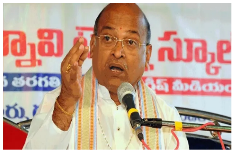
కల్పిస్తున్నట్లు తెలిపారు. ఎదిగి పిల్లల కోసం పేదరికంలో ఉన్న వారి కోసం ఈ పథకం ద్వారా వారంలో ఐదు రోజులు ఐదు గుడ్లు ఇస్తున్నారని, దీనిని కూడా విమర్శించడం తమను చాలా బాధిస్తుందని ఆయన పేర్కొన్నారు. ఆ వ్యాఖ్యలు బాధాకరం

అని విలాసం కాదని విజయ ప్రతాపి రెడ్డి తేల్చి చెప్పారు. గతంలో సుప్రీంకోర్టు కూడా ఈ విషయాన్ని స్పష్టం చేసిందన్నారు. ప్రతి పౌరుడికి రాజ్యాంగంలోని ఆర్టికల్ 21 ప్రకారం జీవించే హక్కు ఉందని, జీవించే హక్కు అంటే కేవలం బతకడమే కాదని గౌరవప్రధానంగా ఆరోగ్యకరమైన పోషకాహారం తీసుకుని బ్రతకడం అని ఆయన గుర్తు చేశారు. కడుపు ఖాళీగా ఉంటే పిల్లలు చదువులపై శ్రద్ధ పెట్టలేరు ఇది అందరి హక్కు అని ఆయన పేర్కొన్నారు. కడుపు ఖాళీగా ఉంటే పిల్లలు చదువు పై శ్రద్ధ పెట్టలేరు, మధ్యాహ్న భోజనం లేకుండా విద్యాహక్కు చట్టం లక్ష్యం నెరవేరదని ఆయన వెల్లడించారు. మధ్యాహ్న భోజన పథకాన్ని కేంద్ర రాష్ట్ర ప్రభుత్వాలు సంయుక్తంగా అమలు చేస్తున్నాయని తెలిపిన ఆయన ఈ పథకం అమలయ్యే వ్యయంలో 60 శాతం కేంద్రానిది, 40 శాతం రాష్ట్రానిది అని పేర్కొన్నారు. పేదరికంలో ఉన్న వారి కోసం ఈ పథకంనేషనల్ ఫుడ్ సెక్యూరిటీ యాక్ట్ అమలు కోసం ఒక కమిషన్ ను నియమించినట్లుగా చెప్పిన ఆయన మధ్యాహ్న భోజనం సక్రమంగా అమలు చేయడం కోసం అవగాహన