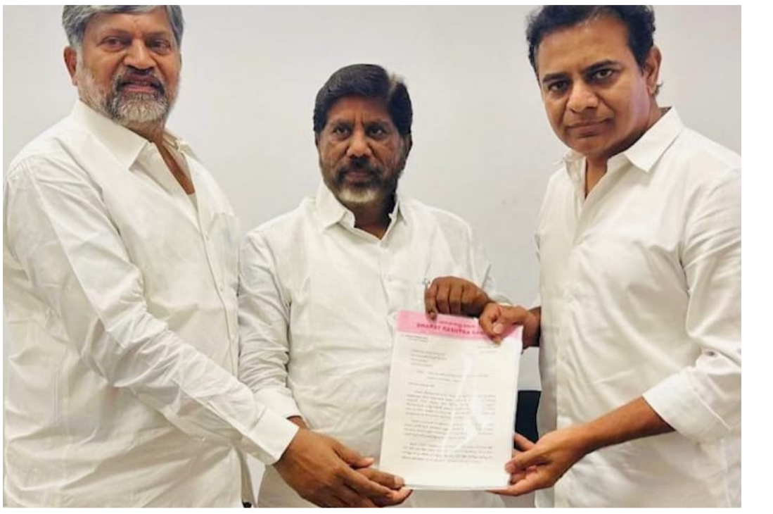
వస్త్ర పరిశ్రమ సమస్యలపై ప్రభుత్వ దృష్టి మరింతగా కేంద్రీకృతమై, తక్షణ పరిష్కార చర్యలు తీసుకుంటుందని నేతన్నలు ఆశాభావం వ్యక్తం చేస్తున్నారు.