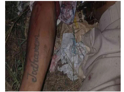
వెంట్రుకలు, గడ్డం, మీసాలు కలిగి ఉన్నట్లు పోలీసులు తెలిపారు. కుడి చేతి పైన "జీఎస్ టెక్నాలజీ" అనే ఇంగ్లీష్ పచ్చబొట్టు తప్పా మరే ఇతర అధికారాలు లభించలేదు.