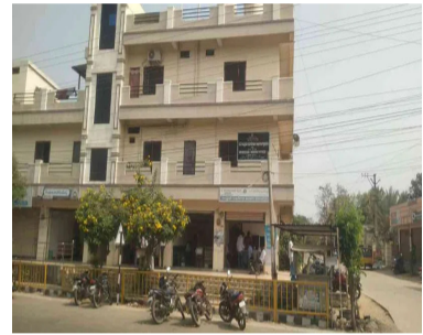
కావాలంటే నిర్వాహకులకు ముందుగానే దబ్బులు చెల్లించాలి. తానిల్లారే కార్యాలయంలో కొందరు అధికారులు సిబ్బంది ఏకైకతం పాతకపోవడంతో అవినీతి అక్రమాలు అక్రమ రవాణా జోరుగా సాగుతున్నా పోలీస్ శాఖ దాడులు చేయడం లేదని ఆరోపణలు వస్తున్నాయి. ఇసుక మాఫియా నిర్వాహకులు పోలీస్ అధికారులకు ప్రతివెల మామూళ్లు ఇచ్చి అక్రమ వ్యాపారం చేస్తున్నారని విమర్శలు ఉన్నాయి. మెదక్ జిల్లాలో పోలీస్ స్టేషన్ లో ఫిర్యాదు చేయడానికి సామాన్యుడు అంత జరుగుతున్న అవినీతి అక్రమాలపై జిల్లా

ముందుపలు చెల్లించుకుంటే పనులు చేయించుకుని పరిస్థితి ఉంది. మెదక్ జిల్లాలో పలు ప్రభుత్వ శాఖల కార్యాలయాల తీరుపై సమస్య తెలంగాణ ప్రత్యేక కథనం ఇంది. రెవెన్యూ మీసేవ నిర్వాహకులదే పెత్తనం..? రెవెన్యూ శాఖలో పనులు కావాలంటే ముందుగా మీసేవ నిర్వాహకులను కలవాల్సివిన పరిస్థితి జిల్లాలో నెలకొంది. రైతుల పాస్ పుస్తకాలు 1బి తో పాటు ఇతర రిజిస్ట్రేషన్ల కావాలంటే ముందుగా మీసేవ నిర్వాహకులను సంప్రదించాల్సి వస్తుంది. కొందరు రెవెన్యూ అధికారులు మీసేవ నిర్వాహకులను మధ్యవర్తిగా చేసుకుని మామూళ్లు వసూలు చేస్తున్నారు. కులం, ఆదాయ ప్రవీకరణ పత్రం తోపాటు నివాస ప్రవీకరణ పత్రం కావాలన్నా మీసేవ నిర్వాహకులకు దబ్బులు ఇవ్వవలసిన పరిస్థితి. భూముల రిజిస్ట్రేషన్ లో చిన్న తప్పి ఉన్నా రిజిస్ట్రేషన్ చేయకుండా అధికంగా దబ్బులు వసూలు చేస్తున్నారు. రెవెన్యూ శాఖలో పనులు