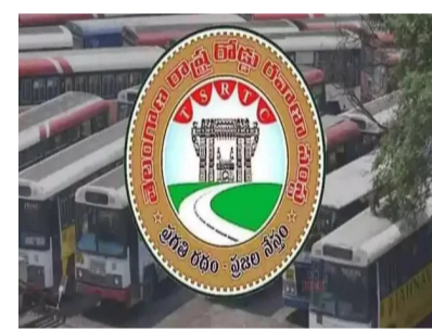
పెరుగుతున్న ప్రయాణికుల అవసరాలకు అనుగుణంగా బస్సుల సంఖ్యను పెంచుతున్నామని తెలిపారు. తెలంగాణలో మహా లక్ష్య పథకం అమలుతో పెరుగుతున్న ప్రయాణికుల అవసరాలను దృష్టిలో ఉంచుకుని ఆర్టీసీ సేవలను విస్తరించేందుకు ప్రభుత్వం చర్యలు

హైదరాబాద్: ఆర్టీసీ ప్రయాణికులకు మంత్రి పొన్నం ప్రభాకర్ శుభవార్త చెప్పారు. వచ్చే వారం రోజుల్లో మహిళా సమాఖ్యల ద్వారా 350 కొత్త బస్సులను ప్రారంభిస్తున్నట్లు రవాణా శాఖ మంత్రి పొన్నం ప్రభాకర్ తెలిపారు. మహిళా సమాఖ్యల ద్వారా కొత్త బస్సులను కొనుగోలు చేసే ఆర్టీసీకి అడ్డం పెట్టిన మహిళలకు కావలసిన ఆర్థిక మద్దతును ఆర్టీసీ అందిస్తుందని ఆయన తెలిపారు. ఆ జిల్లాలో ప్రతి మండలానికి ఒక బస్సు అదనంగా కేటాయింపు ఆర్టీసీ సేవల విస్తరణ పైన ఆయా జిల్లాల ప్రజలు తిని ధులతో, అధికారులతో సమీకృత సమావేశాన్ని నిర్వహించి వారి మంత్రి పొన్నం ప్రభాకర్ మహా బూజ్ నగర్ జిల్లాలో ప్రతి మండలానికి ఒక బస్సు కేటాం బిల్లును చెప్పారు. మహా లక్ష్య పథకం కారణంగా