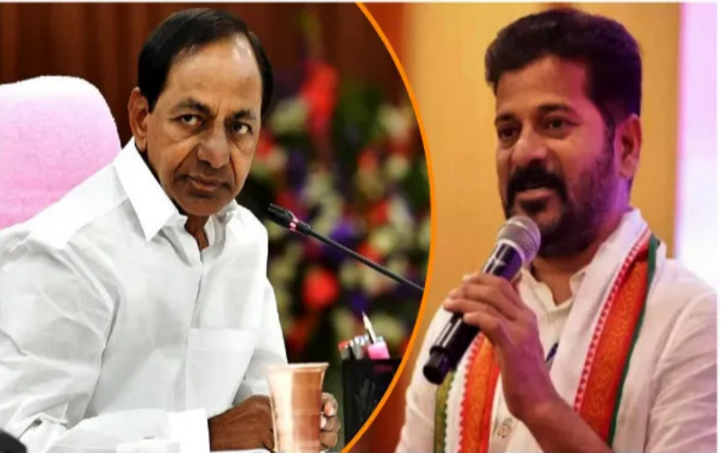
అసెంబ్లీ స్థానాలు మరో 60 పెరిగి 179కి చేరుకునే అవకాశం

హైదరాబాద్: తెలంగాణ రాజకీయాల్లో కీలక మలుపు, లోక సభ - అసెంబ్లీ స్థానాల పునర్విభజన రాష్ట్ర రాజకీయ స్వరూపాన్ని మార్చేస్తోంది. కేంద్ర తాజా నిర్ణయం సందేహంగా మారుతోంది. ప్రస్తుతం రాష్ట్రంలో ఉన్న ఎంపీ- ఎమ్మెల్యే స్థానాలు భారీ గా పెరగనున్నాయి. ప్రతి జిల్లాలో ప్రస్తుతం ఉన్న అసెంబ్లీ స్థానాలు 50 శాతం మేర పెంచేందుకు రంగం సిద్ధమైంది. కొత్త నియోజకవర్గాల పైనా రాదాపు స్పష్టత వస్తోంది. అయితే, రాజకీయంగా కఠినాచ్యే లెక్కలు మాత్రం అనక్రి కంగా ఉన్నాయి. తెలంగాణలో ఎన్నికలు 2028 కాదు. 2029 లోనే జరిగే అవకాశాలు ఉన్నాయి. కేంద్రం తాజాగా ఎంపీ- ఎమ్మెల్యే స్థానాలు 50 శాతం మేర పెంచుతూ... మహిళా రిజర్వేషన్ అమలు దిశగా కఠినత వేగవంతం చేసింది. అందులో భాగంగా తెలంగాణలో ఎమ్మెల్యే, ఎంపీ సీట్ల సంఖ్య గణనీయంగా పెరగనున్నాయి. తెలంగాణలో