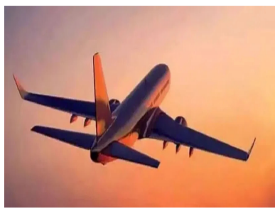
భద్రత, సంస్థల విశ్వాస నీయతపై ప్రభావం చూపిస్తాయని హెచ్చరించింది. గత ఏడాది అపూర్వాబాద్ విమాన ప్రమాదం తర్వాత ఎయిరిండియాపై డీజీసీఏ నిర్వహించిన

సంఖ్య ఎక్కువని.. లోపాలు కూడా వాటిలోనే అధికంగా ఉన్నాయని స్టాండింగ్ కమిటీ ఆన్ సివిల్ ఏవియేషన్ వెల్లడించింది. ఫిబ్రవరి మూడు వరకు 405 విమానాల్లో ఆడిట్ నిర్వహించగా.. 148 పైలట్లలో లోపాలు ఉన్నాయని పేర్కొన్నది. కొన్ని లోపాలు రిపేట్ అయ్యాయని తెలిపింది. 166 ఎయిరిండియా, 101 ఎయిరిండియా ఎక్స్ ప్రెస్ విమానాల్లో తనిఖీలు చేపట్టారు. వాటిల్లోనూ లోపాలు వెలుగు చూశారు. దాదాపు సగం ఈ రెండు విమానయాన సంస్థలకు చెందిన వాటిలోనే ఉన్నాయి. ఈ స్థాయిలో లోపాలు వెలుగు చూడటంపై కమిటీ ఆందోళన వ్యక్తం చేసింది. ఇవి ప్రయాణికుల