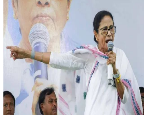
ఆరోపించారు. 'బిహార్లో చేసినట్లుగానే రైల్వేలను ఉపయోగించుకుని బయట ప్రాంతాల నుంచి ఓటర్లను రప్పించేందుకు బీజేపీ ప్లాన్ చేస్తోంది' అని అన్నారు. ఈ సందర్భాన్ని విమర్శించారు.

బంకూ: భారతీయ జనతా పార్టీ (బీజేపీ)పై పశ్చిమబెంగాల్ ముఖ్యమంత్రి, డిఎన్ఏ ఆధిపత్య ముఖా బెనర్జీ (మిమెన్) డిఎఫ్ఐఎఫ్ (విదేశీ విదేశీ) పార్టీగా అభివర్ణించారు. దేశంలో బెంగాలీ మాట్లాడే వలస కార్మికులను టార్గెట్ చేస్తున్నారని, బీజేపీ పాలిత రాష్ట్రాల్లో వారిని వేధిస్తున్నారని, అవమానాలకు గురిచేస్తున్నారని ఆరోపించారు. బాంకూరాల్లో మంగళవారంనాడు జరిగిన ఎన్నికల ప్రచార సభలో ముఖా బెనర్జీ ప్రసంగించారు. డిఎన్ఏ అభ్యర్థులు ఎవరనేది కాకుండా తన నాయకత్వాన్ని మాత్రమే చూడాలని ఈ సందర్భంగా ఓటర్లను మమతా బెనర్జీ కోరారు. 294 నియోజకవర్గాల్లో తననే అభ్యర్థిగా చూడాలని విజ్ఞప్తి చేశారు. ఓటర్ల జాబితాలో అవకతలను ప్రధానంగా ఆమె తన ప్రసంగంలో ప్రస్తావించి, ఒక్కోజూ 30,000 అక్షేపంపై దాఖలైనట్లు పార్టీ నేత అభిషేక్ బెనర్జీ వద్ద సమాచారం ఉందని తెలిపారు. బెంగాల్ ఎన్నికల ఫలితాలను ప్రభావితం చేసేందుకు బిహార్, రాజస్థాన్, హరియానా, ఉత్తర ప్రదేశ్ రాష్ట్రాల నుంచి ఓటర్లను బీజేపీ దిగుమతి చేసుకునేందుకు ప్రయత్నాలు సాగిస్తోందని