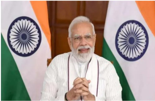
ఆన్లైన్ గ్రాంట్లను విడుదల చేసే 247.94 కోట్ల రూపాయల కేంద్రం మంజూరు చేసింది. 2025-26 ఆర్థిక సంవత్సరానికి సంబంధించి మొదటి విడత ఆన్ లైన్ గ్రాంట్ల కింద ఈ నిధులను కేటాయించింది. దేశవ్యాప్తంగా ఆరు రాష్ట్రాలకు కలిపి

న్యూఢిల్లీ, మార్చి 31: తెలంగాణ రాష్ట్రానికి కేంద్రం శుభవార్త చెప్పింది. 15వ ఆర్థిక సంఘం నిఫార్మల మేరకు తెలంగాణ సహా ఆరు రాష్ట్రాలకు కేంద్ర ప్రభుత్వం 1500 కోట్ల రూపాయలకు పైగా గ్రాంట్ లను విడుదల చేసింది. ఇక తెలంగాణ రాష్ట్రానికి ఈ సందర్భంగా కేంద్రం తీపి కబురు చెప్పింది. 15వ ఆర్థిక సంఘం నిఫార్మల మేరకు రాష్ట్రంలోని పంచాయతీరాజ్ సంస్థల బలోపేతానికి 247.9 కోట్ల రూపాయల నిధులను విడుదల చేస్తూ కేంద్ర పంచాయతీ రాజ్ మంత్రిత్వశాఖ కీలక ఉత్తర్వులను జారీ చేసింది. రాష్ట్రంలోని 12 వేల 600 గ్రామ పంచాయతీల అభివృద్ధి కోసం కేంద్ర ప్రభుత్వం 15వ ఆర్థిక సంఘం నిధులను విడుదల చేయడంతో తెలంగాణ రాష్ట్రంలోని గ్రామపంచాయతీల అభివృద్ధి త్వరితగతిన జరగడానికి అవకాశం ఉంటుందన్న అభిప్రాయం వ్యక్తం అయింది. ఆన్లైన్ గ్రాంట్లను విడుదల చేసే 2025-26 ఆర్థిక సంవత్సరానికి సంబంధించి మొదటి విడత ఆన్ లైన్ గ్రాంట్ల కింద ఈ నిధులను కేటాయించింది. దేశవ్యాప్తంగా ఆరు రాష్ట్రాలకు కలిపి