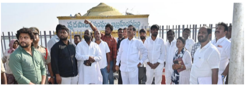
ప్రజలకు ఆహ్లాదకర వాతావరణం కల్పించడంతో పాటు, ఇబ్రహీంపట్నం గుర్తింపును పెంచేలా మినీ ట్యాంక్ బండ్ తరహాలో అభివృద్ధి చేయాలని ఎమ్మెల్యే స్పష్టం చేశారు. చెరువు కట్టపై భద్రతను దృష్టిలో ఉంచుకుని ఇరు వైపులా సీట్స్ రైలింగ్లు ఏర్పాటు చేయడం, రాత్రి సమయంలో సౌకర్యంగా ఉండేలా ఆధునిక లైటింగ్ వ్యవస్థను అమలు చేయడం వంటి పనులు

(హైదరాబాద్ ఎస్టేట్ ప్రతినిధి) ఏప్రిల్ 2:- ఇబ్రహీంపట్నం నియోజకవర్గ అభివృద్ధిలో కీలక భాగంగా పెద్ద చెరువు కట్టను ఆధునిక సదుపాయాలతో తీర్చిదిద్దే పనులు వేగంగా కొనసాగుతున్నాయి. ఈ అభివృద్ధి కార్యక్రమాలను ఎమ్మెల్యే మల్ రెడ్డి రంగారెడ్డి స్వయంగా పరిశీలించి పనుల పురోగతిపై అధికారులకు సూచనలు అందించారు. సుమారు 18 కోట్ల రూపాయల వ్యయంతో చేపట్టిన ఈ ప్రాజెక్ట్ ద్వారా చెరువు కట్టను పూర్తిగా రూపొందించడం చెందేలా ప్రణాళిక రూపొందించారు. స్థానిక