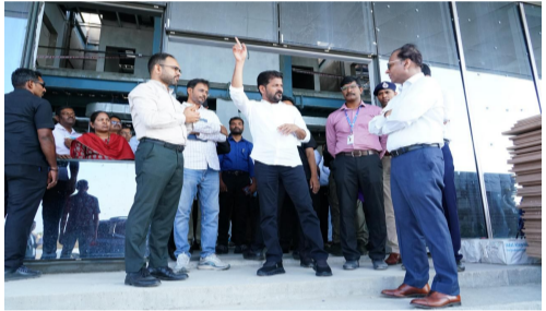
(హైదరాబాద్ ఎస్టేట్ ప్రతినిధి) ఏప్రిల్ 2:- తెలంగాణను భవిష్యత్తుకు సిద్ధం చేసే దిశగా రాష్ట్ర ప్రభుత్వం ప్రతిష్టాత్మకంగా

చేపట్టిన భారత్ ప్యూచర్ సిటీ ప్రాజెక్ట్ పనులు వేగంగా ముందుకు సాగుతున్నాయి. ఈ నేపథ్యంలో ప్యూచర్ సిటీ పరిధిలో నిర్మాణంలో ఉన్న కీలక భవనాల పురోగతిని ముఖ్యమంత్రి ఎ. రేవంట్ రెడ్డి స్వయంగా పరిశీలించారు. ప్యూచర్ సిటీ డెవలప్ మెంట్ అథారిటీ (ఫీజిజిఆ) కార్యాలయ నిర్మాణ స్థలాన్ని సందర్శించిన సీఎం, అక్కడ జరుగుతున్న పనుల నాణ్యత, వేగంపై సమీక్ష నిర్వహించారు. భవన నిర్మాణంతో పాటు ఆ ప్రాంతం మొత్తానికి రూపొందిస్తున్న మాస్టర్ ప్లాన్, లేఅవుట్లను కూడా పరిశీలించి, భవిష్యత్ అవసరాలకు అనుగుణంగా రాజకీయ ఉండేలా అధికారులకు సూచనలు చేశారు. అదే విధంగా యంగ్ ఇండియా సిల్వీ యూనివర్సిటీ (ఐఐఐఐఐ) పరిధిలో నిర్మాణంలో ఉన్న విద్యా భవనాలు, లైబ్రరీ