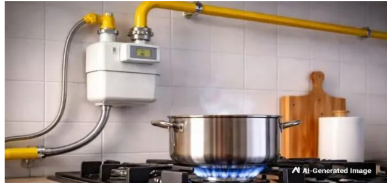
ప్రస్తుతం అంతర్జాతీయంగా ముడిపెరుగు ధరలు పెరగడం, వాణిజ్య సిలిండర్ ధరలు అకాశాన్నంటుతున్న తరుణంలో పిఎన్జీకి మారడం ఆర్థికంగా నిపుణులు సూచిస్తున్నారు.

ఆ అవసరం ఉండదు. నిరంతరం గ్యాస్ సరఫరా అవుతునే ఉంటుంది. మైగా ఇది ఎలీజీ కంటే సురక్షితమైనది. గాలి కంటే తేలికగా ఉండటం వల్ల లీకేజీ జరిగినా ప్రమాద తీవ్రత చాలా తక్కువగా ఉంటుంది. అంతేకాకుండా, సిలిండర్ల ముందుగా డబ్బు చెల్లించాల్సిన పని లేకుండా, వాడుకున్న గ్యాస్కు మాత్రమే నెలాఖరున బిల్లు కట్టే సౌలభ్యం ఇందులో ఉంది. కొత్త కనెక్షన్ కోసం సంప్రదించాల్సిన సంబంధిత గ్యాస్ సిలిండర్ అధ్యక్షులతో తెలుగు రాష్ట్రాల్లోని ప్రధాన నగరాల్లో ఈ సేవలు అందుబాటులో ఉన్నాయి. కొత్త కనెక్షన్ కోసం ఆసక్తి గల వారు ఈ కింది సంబంధిత సంప్రదించవచ్చు..