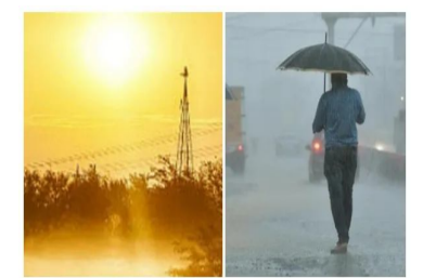
అవకాశం ఉందని కూడా వాతావరణ శాఖ తెలిపింది. ఇక, శనివారం 73 మండలాల్లో తీవ్రవడగాల్లులు, 17 మండలాల్లో వడగాల్లులు, ఆదివారం 32 మండలాల్లో తీవ్రవడగాల్లులు, 21 మండలాల్లో వడగాల్లులు పీసాదయి తాజా గా వెల్లడించారు. ఎండ ప్రతే పట్టి ప్రజలు తగిన జాగ్రత్తలు తీసుకోవాలని అధికారులు సూచనలు చేస్తున్నారు. రేపు త్రీకాకుళం జిల్లాలో 16, విజయనగరం 24, పార్వతీపురం మన్యం 15, అల్లూరి 3, పోలవరం 9, అనకాపల్లి 2, కాకినాడ 3, తూర్పు గోదావరి 1 మండలాల్లో తీవ్రవడగాల్లులు(73) వీచే అవకాశం ఉందని చెప్పారు. అలాగే త్రీకాకుళం 2, పోలవరం 2, అనకాపల్లి 1, కాకినాడ 2, తూర్పుగోదావరి 3, ఏలూరు 4, ఎన్టీఆర్ 1, పల్నాడు 2 మండలాల్లో వడగాల్లులు(17) ప్రభావం చూపను స్తుట్లు తెలిపారు. శనివారం మన్యం(జి) భామినోటి 41.8%జి, చిత్తూరు(జి) రాయలపేట లో 41.4%జి, అనకాపల్లి(జి) నాశవరంలో 40.9%జి, త్రీకాకుళం(జి) జి.సిగండలో 40.5%జి, నర్సాపల్లి (జి) అలమారు, కడప(జి) బద్వేల్ లో 40.4%జి, ఏలూరు(జి) ఏలూరు జిగండ, తిరుపతి(జి) రేడిగుంట, ఏలూరు నగరం(జి) రాజాలో 40.3%జి, కృష్ణా(జి) కంకిపాడులో 40.1%జి, కర్నూలు (జి) తోవి 40%జి చొప్పున గరిష్ట ఉష్ణోగ్రతలు సమాచారం వెల్లడించారు.

అమరావతి : తెలుగు రాష్ట్రాల్లో వాతావరణం అనూహ్యంగా మారుతోంది. విభిన్న పరిస్థితులు కొనసాగా గుతున్నాయి. కొన్ని జిల్లాల్లో వడగాల్లులు ఉంటే.. మరి కొన్ని జిల్లాల్లో వర్షం ముప్పు పొంచి ఉంది. పీడుగులు పడే అవకాశం ఉందని వాతావరణ శాఖ హెచ్చరించింది. పలు ప్రాంతాల్లో మధ్యాహ్నం పూట ఎండలు 40 నుంచి 45 డిగ్రీల మధ్య సమాధులు అవుతున్నాయి. ఇదే సమయంలో పలు జిల్లాల్లో రానున్న రెండు రోజులు పీడుగులు.. ఈదురు గాలులతో పాటుగా భారీ వర్షాలు కురిసే అవకాశం ఉందని తాజాగా హెచ్చరికలు జారీ అయ్యాయి. తెలుగు రాష్ట్రాల్లో వాతావరణ పరిస్థితుల్లో మార్పులు జరుగుతున్నాయి. కొన్ని ప్రాంతాల్లో బయట తిరగాలబే భయపడతాల్సిన పరిస్థితి ఏర్పడింది. ఎండగాడ్లు కారణంగా జనం అస్వస్థతకు గురవుతున్నారు. మండే ఎండలతో అల్పాదిపోతున్న వేళ రెండు తెలుగు రాష్ట్రాల వ్యాప్తంగా వర్షాలు కురిసే అవకాశం ఉందని వాతావరణ శాఖ వెల్లడించింది. తెలంగాణలో మరో మూడు రోజులు వర్షాలు కురిసే అవకాశం ఉందని వాతావరణ శాఖ తెలిపింది. ద్రోణి, అనంతపురం ప్రభావంతో రాష్ట్ర వ్యాప్తంగా మోస్తరు వర్షాలు కురిసే అవకాశం ఉందని వెల్లడించింది. శని, ఆది సోమవారాల్లో ఉమ్మడి నిజామాబాద్, కరీంనగర్, మెదక్, ఆదిలాబాద్, సంగారెడ్డి, వరంగల్, రంగారెడ్డి, ఖమ్మం, నల్గొండ, హైదరాబాద్ జిల్లాల్లో వర్షాలు పడే సూచనలు ఉన్నాయని వాతావరణ శాఖ తెలిపింది. ఉరుములు, మెరుపులు, ఈదురు గాలులతో కూడిన వర్షాలు పడే అవకాశం ఉందని పేర్కొంది. ఈ మేరకు పలు జిల్లాలకు ఎల్లో అల్ప జారీ చేసింది. వాతావరణ శాఖ తాజా హెచ్చరికలతో విధంగా అంద్రప్రదేశ్లోని పలు ప్రాంతాల్లో వర్షాలు పడే