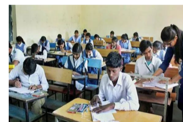
ఇంగ్లీషు ప్రశ్నా పత్రం కఠినంగా ఇవ్వటంతో పాఠశాల కొన్ని ప్రశ్నలు బ్లా ప్రాంతం వచ్చాయని ఉపాధ్యాయులు.. విద్యార్థులు ఆవేదన వ్యక్తం చేస్తున్నారు.

అమరావతి : పదో తరగతి పరీక్షల్లో కొన్ని ప్రశ్నల్లో పాఠశాలల్లో దొర్లాయి. దీంతో, ఈ ప్రశ్నలపై ప్రభుత్వానికి పేరెంట్స్ నుంచి వివరాలు అందడం జరిగింది. తమ పిల్లలకు మార్కులు తగ్గే అవకాశం ఉందని ప్రభుత్వానికి నివేదించారు. దీంతో, పాఠశాలల్లో దొర్లిన రెండు సబ్జెక్టుల్లో మార్కులు కలపాలని తాజాగా ఎస్సీ సీని డిప్యూటీ ప్రాధికారి కు నిర్ణయించారు. ఇంగ్లీషు.. పాఠశాల పరీక్షల్లో కలపాలని మార్కులు పైన నిర్ణయం తీసుకుంది. అయితే, ఈ మార్కులు కలిపే విధంగా పైన డిప్యూటీ అధికారికి గా ఈ రోజు సుప్రత ఇష్యునుంది. పదో తరగతి