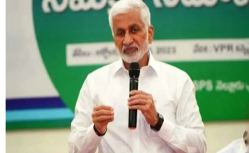
అమరావతిని రాష్ట్ర రాజధానిగా రాజకీయంగా మాత్రమే పరిష్కారమైన అంశ మని విజయసాయిరెడ్డి తేల్చి చెప్పారు. అమరావతికి చట్టబద్ధత కల్పించడానికి ఉద్దేశించిన ఏపీ పునర్విభజన చట్టం లోక్ సభలో

అమరావతి: రాష్ట్ర రాజధానిగా అమరావతిని ఖరారు చేస్తూ పార్లమెంట్ చట్టాన్ని ఆమోదించిన అనంతరం పలు కీలక పరిణామాలు చోటు చేసుకుంటోన్నాయి. లోక్ సభ ఆమోదించిన సమయంలో మాచిగన్ ప్రతిపాదనను తెరవేసి తీసుకొచ్చారు మాజీ ముఖ్యమంత్రి, వైఎస్ఆర్ కాంగ్రెస్ పార్టీ అధినేత వైఎస్ జగన్మోహన్ రెడ్డి. మచిలీపట్నం- విజయవాడ- గుంటూరు (మాచిగన్) ప్రాంతాన్ని రాజధానిగా అభివృద్ధి చేయాలని సూచించారు. అదే సమయంలో వైఎస్ఆర్ పీకే చెందిన రాజ్యసభ మాజీ సభ్యుడు వీ విజయసాయిరెడ్డి తెరవేసింది