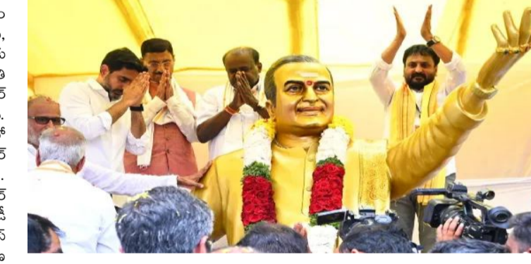
కర్ణాటక: కర్ణాటక రాష్ట్రంలోని సింధునగర్ లో ఏపీ టి. విద్యాశాఖ మంత్రి నారా లోకేశ్ ఆవిష్కరించారు. ఈ సందర్భంగా కేంద్ర ఉక్కు మంత్రి హోమీ భట్టచర్ల, కేంద్ర రక్షణ శాఖ సహాయ మంత్రి సంజయ్ సేత్ లతో