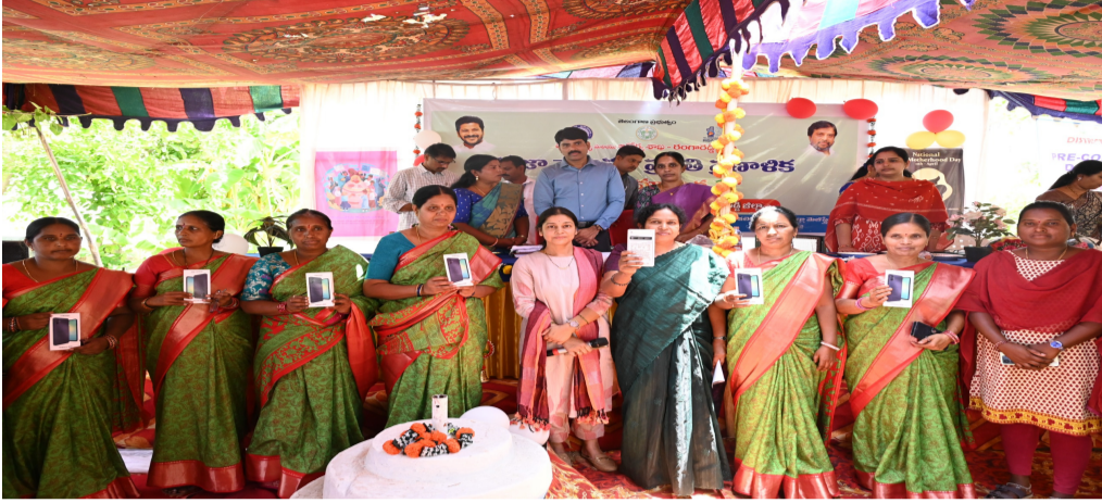
- జిల్లా కలెక్టర్ సి. నారాయణ రెడ్డి

(హైదరాబాద్ ఎస్టేట్ ప్రతినిధి) ఏప్రిల్ 8:-