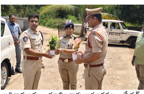
అధికారులకు సూచించారు. అనంతరం స్టేషన్ సిబ్బందితో సమావేశమైన ఎస్పీ గారు, విధుల్లో క్రమశిక్షణ, నిబద్ధత కలిగి ఉండాలని పేర్కొన్నారు. ప్రజలకు అందుబాటులో ఉంటూ ప్రజాసేవయే పరమావధిగా పనిచేయాలని, విధుల్లో నిర్లక్ష్యం వహిస్తే శాఖాపరమైన చర్యలు తీసుకుంటామని హెచ్చరించారు.

పీట్లను ప్రతి వారం పోలీస్ స్టేషన్ కు పిలిపించి కౌన్సిలింగ్ నిర్వహించాలని, చట్ట వ్యతిరేక కార్యకలాపాలకు పాల్పడితే కఠిన చర్యలు తప్పవని హెచ్చరికలు జారీ చేయాలన్నారు. సమాజంలో వైతన్యం తేవడానికి రోడ్డు భద్రత, సైబర్ క్రైమ్లపై ప్రజలకు అవగాహన కల్పించాలన్నారు. ముఖ్యంగా పాఠశాలలు, కళాశాలల్లో విద్యార్థులకు, మహిళలకు మరియు బాలబాలికలకు వారి రక్షణకు సంబంధించిన చట్టాలపై నిరంతరం అవగాహన కార్యక్రమాలు నిర్వహించాలని సూచించారు. పోలీసు అధికారులు తరచుగా గ్రామాలను సందర్శించాలని, గ్రామ మహిళా సంరక్షణ కార్యదర్శులతో సమన్వయం చేసుకోవాలని తెలిపారు. వారు అందించే సమాచారంపై తక్షణమే స్పందించి సమస్యలను పరిష్కరించాలని ఆదేశించారు. గంజాయి ఆక్రమ రవాణాపై ఉక్కుపాదం మోపాలని, సీసీటీవీ కెమెరాల ఏర్పాటుపై గ్రామస్థులను ప్రోత్సహించాలని, స్టేషన్ లో పెండింగ్ లో ఉన్న కేసులను, సీజ్ చేసిన వాహనాలను త్వరితగతిన పరిష్కరించాలని