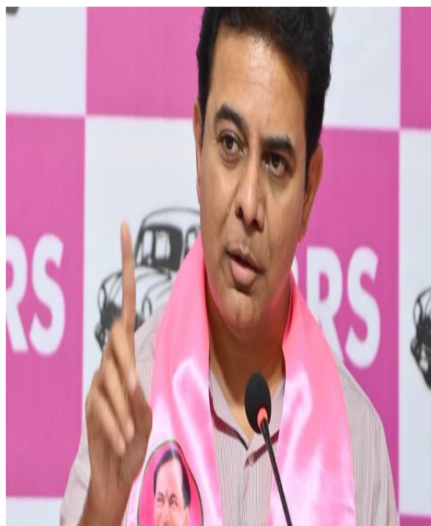
డీలిమిటేషన్ అంశం సంబంధం లేకుండా, తెలంగాణ అసెంబ్లీ సీట్లను 2028 లోపు పెంచేలా ఈ పార్లమెంట్ సమావేశాల్లోనే ప్రత్యేక బిల్లు తీసుకురావాలని కేటీఆర్ డిమాండ్ చేశారు.

దీనితో పాటు తెలంగాణ పునర్విభజన చట్టం ప్రకారం రాష్ట్రంలో అసెంబ్లీ సీట్ల పెంపు అనేది మా రాష్ట్ర హక్కు అని కేటీఆర్ అన్నారు. జమ్మూ కశ్మీర్, అసోంలో దేశవ్యాప్త డీలిమిటేషన్తో సంబంధం లేకుండా సీట్ల పెంపు చేపట్టిన కేంద్రం, తెలంగాణ విషయంలో ఎందుకు నిర్లక్ష్యం చేస్తోందని ప్రశ్నించారు. మహిళా బిల్లుతో, దేశవ్యాప్త