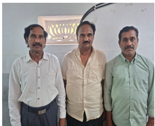
అరెస్టు చేసి న్యాయస్థానంలో హాజరు పరిచామన్నారు. మిగతా నిందితులు పరారీలో ఉన్నారని సీబి తెలిపారు. ఈ కేసు పై మరింత దర్యాప్తు కొనసాగుతుందన్నారు. పరారీలో ఉన్న నిందితుల కోసం ప్రత్యేక బృందాలు గాలిస్తున్నారని సీబి తెలిపారు.