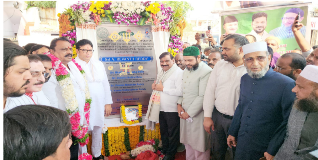
కొనసాగుతున్నాయని వివరించారు. ప్రభుత్వం భారీ నిధులను కేటాయిస్తూ, ముఖ్యమంత్రి రేవంత్ రెడ్డి నాయకత్వంలో నగరాభివృద్ధి వేగంగా కొనసాగుతోందని చెప్పారు. పర్యాటక రంగాన్ని ప్రోత్సహించే దిశగా కూడా ప్రత్యేక ప్రణాళికలు అమలు చేస్తున్నట్లు వెల్లడించారు. గతంలో చోటుచేసుకున్న లోపాలను సవరించుకుంటూ, ప్రతి

హైదరాబాద్ ఎస్టేట్ ప్రతినిధి ఏప్రిల్ 17:- రాజేంద్రనగర్ నియోజకవర్గంలో అభివృద్ధి కార్యక్రమాలు వేగం పుంజుకున్నాయి. శాస్త్రిపురం ప్రాంతంలో సుమారు 71 కోట్ల వ్యయంతో నిర్మించిన రైల్వే ఓవర్ బ్రిడ్జిని రాష్ట్ర ఐటీ, పరిశ్రమలు మరియు శాసనసభ వ్యవహారాల శాఖ మంత్రి శ్రీధర్ బాబు, ప్రభుత్వ చీఫ్ విప్ పట్నం మహేందర్ రెడ్డి, ఎమ్మెల్యే ప్రకాష్ గౌడ్ కలిసి ప్రజలకు అంకితం చేశారు. అదే సందర్భంగా ఫలక్సూమా బస్ డిపో నుంచి మైలార్ దేవ్పల్లి వరకు 490 మీటర్ల పొడవుతో నిర్మించిన నాలుగు లేన్ల రహదారిని కూడా ప్రారంభించారు. ఈ రహదారి ద్వారా ట్రాఫిక్ సమస్యలు తగ్గి, ప్రజలకు రాకపోకలు మరింత సులభతరం అవుతాయని అధికారులు భావిస్తున్నారు. ఈ కార్యక్రమంలో మాట్లాడిన మంత్రి శ్రీధర్ బాబు, హైదరాబాద్ను పాత నగరంగా కాకుండా అసలైన నగరంగా అభివృద్ధి చేయాలనే లక్ష్యంతో ముందుకు సాగుతున్నామని తెలిపారు. జిహెచ్ఎస్ పరిధిలో అంతర్జాతీయ ప్రమాణాలతో మౌలిక సదుపాయాలను విస్తరిస్తూ, నగరాన్ని దేశంలోనే ప్రముఖ మెట్రోపాలిటన్గా తీర్చిదిద్దేందుకు చర్యలు