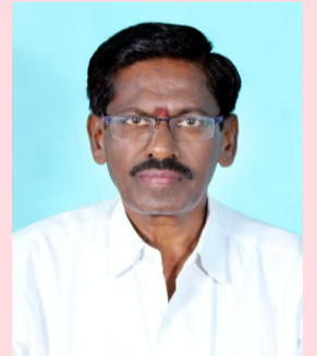
కవి రచయిత, గజపేట్ ప్రాసోపాధ్యాయులు, ఎలికట్ట విలయ్య, మం: చేర్యాల, జిల్లాస్పెక్టివీట.

రోడ్డు ప్రమాదాలకు రెండు ప్రధాన కారణాలు ఒకటి ఆగం రెండోది వేగం అంతేగాక మరెన్నో... ఆలస్యంగా బయలుదేరడం.. అందోళన చెందడం ఆతురత అలసత్వం అలజడి తికమక తీరులెన్నో... మనం మంచిగా పోతున్న.. ఎదుటివారు అలానే? మద్దు తాగి వాహనాలు నడపరాదు, సాగరాదు నిద్ర వస్తే వాహనం నడపకుండా ఆపడం మంచిది బైకుపై వెళ్తున్నప్పుడు హెల్మెట్ విధిగా ధరించాలి ప్రయాణిస్తున్నప్పుడు సీట్ బెల్ట్ పెట్టుకోవాలి సెల్ ఫోన్ లో మాట్లాడుతూ ఏ వాహనం నడపరాదు కాలినడకన వెళ్తున్నప్పుడు ఫుల్ పాత్ పైనే నడవాలి రోడ్డు దాటవలసి వచ్చినప్పుడు కుడి ఎడమలు చూడాలి జీత్రా క్రాసింగ్ వద్దనే రోడ్డు దాటితే మరి మంచిది పశుపక్ష్యాదులు కుక్కలు కోతులను గమనిస్తుండావి టర్నింగ్ ల దగ్గర అత్యంత జాగ్రత్తగా నడపాలి అతివేగం ప్రమాదకరం అలా అని అతి నిదానం అంతే రోడ్డు నియమాలు అందరం విధిగా పాటిద్దాం మన పల్ల ఇతరులకు ఇతరుల పల్ల మనకు ప్రమాదాలు జరగకుండా జాగ్రత్త వహిద్దాం ప్రాణం దండిది మనం నిండుగా జీవిద్దాం కుటుంబంలో ఎవరికీ లోటు కలుగకుండా చూద్దాం సురక్షితంగా అందరం గమ్యం చేరుదాం సర్వేజనా సుఖినీభవంతుని కోరుదాం.