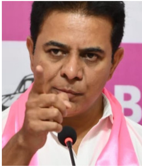
రేవంత్ రెడ్డి పై మాత్రమే చిన్నది కాదని మెదడు కూడా చిన్నదేనని ఎద్దేవా చేశారు. కాగా, ఎల్లుండి జగిత్యాలలో జరగనున్న బహిరంగ సభలో జీవన్ రెడ్డి బీఆర్ఎస్ పార్టీలో చేరనున్నారు.

ముఖ్యమంత్రికి సమయం లేదా అని ప్రశ్నించారు. ఇక్కడ కేటీఆర్ కీలక బహిరంగ సభ జరుగుతుంటే టీవీల్లో కేటీఆర్తో పాటు తన మేడిగడ్డ పర్యటన కూడా చూపించాలని, అలాగే పత్రికల్లో పతాక శీర్షికన కేటీఆర్తో పాటు తన వార్త రావాలనే చిల్లర ప్రయత్నం రేవంత్ రెడ్డి చేస్తున్నారని ఆరోపించారు. అలాగే జగిత్యాల వచ్చే రోడ్డు మూడేళ్లలో గుర్తుకు రాలేదు కానీ, ఇప్పుడు కేటీఆర్ సభ అనేసరికి రోడ్డును తప్పిస్తున్నారని మండిపడ్డారు. కోరుట్ల నుంచి ఎవరూ రాకుండా తప్పిస్తున్నారని ఆరోపించారు. గతంలో ఎన్నో బహిరంగ సభలు జరిగాయని, ఇప్పుడు కూడా విజయవంతమవుతుందని ధీమా వ్యక్తం చేశారు.