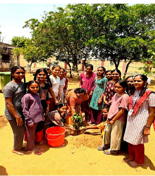
అరోగ్యకరమైన జీవన విధానాలను ప్రోత్సహించడం లక్ష్యంగా అధికారులు పనిచేస్తున్నారు.

డ్రైవ్ కార్యక్రమం మొదటి రోజు జిల్లా యంత్రాంగం అధ్యక్షులలో నిర్వహించబడింది. ప్రతి హాస్టల్ కు నియమించిన ప్రత్యేక అధికారులు ఎస్సీ, ఎస్టీ, బీసీ, మైనారిటీల హాస్టల్ లు రెసిడెన్షియల్ పాఠశాలల్లో విస్తృతంగా తనిఖీలు నిర్వహించారు. ఈ సందర్భంగా అధికారులు చేపట్టిన చర్యలు ఇలా ఉన్నాయి: వంటగదులు, భోజనశాలలు, హాస్టల్ ప్రాంగణాలను సమగ్రంగా పరిశీలించడం, పాత్రలు నిల్వ ప్రదేశాలను శుభ్రపరచడం, ఆహార నాణ్యత మరియు నిల్వ విధానాలను దృఢీకరించడం వంటి అంశాలను సమీక్షించారు. అదనంగా సిబ్బంది విద్యార్థులకు పరిశుభ్రత, సురక్షిత వంటపై అవగాహన కల్పించారు. సురక్షిత తాగునీరు అందుబాటులో ఉండాలి, మురుగునీటి పారుదల సక్రమంగా జరుగుతోందా అనే అంశాలను కూడా పరిశీలించారు. ఈ కార్యక్రమం ద్వారా సంక్షేమ విద్యా సంస్థల్లో విద్యార్థులకు మెరుగైన వాతావరణం కల్పించడం,