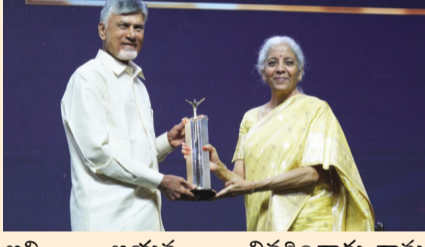
అని ఆయన వివరించారు. తాను సంస్కరణలకు ముందు, ఆ తర్వాత దేశ పరిస్థితిని క్షుణ్ణంగా అధ్యయనం చేశానని చంద్రబాబు తెలిపారు. "సంస్కరణలకు అనుగుణంగానే విజన్ 2020ని అమలు చేశాం. ఇప్పుడు హైదరాబాద్ లో కనిపిస్తున్న అభివృద్ధి ఫలాలు దాని ఫలితమే. సాంకేతికతను ఉపయోగించుకుని అభివృద్ధి దిశగా ప్రయాణించాలి" అని ఆయన పేర్కొన్నారు.

ఆంధ్రప్రదేశ్ ముఖ్యమంత్రి చంద్రబాబు ప్రతిష్ఠాత్మక పురస్కారం అందుకున్నారు. ప్రముఖ మీడియా సంస్థ ఎకనమిక్ టైమ్స్ ముంబైలో నిర్వహించిన ఎక్స్ లెన్స్ అవార్డుల కార్యక్రమంలో ఆయనకు 'బిజినెస్ రిఫార్టర్ ఆఫ్ ది ఇయర్' అవార్డును ప్రధానం చేశారు. పాలనా సంస్కరణలకు చేసిన కృషికి గుర్తింపుగా ఆయన ఈ గౌరవాన్ని పొందారు. అవార్డు స్వీకరించిన అనంతరం చంద్రబాబు మాట్లాడుతూ, టెక్నాలజీని అందించుచున్న అభివృద్ధిలో ముందుకు సాగాలని పిలుపునిచ్చారు. "పేదరిక నిర్మూలన కోసం మేం తీసుకొచ్చిన పీ4 పథకం ఒక గేమ్ ఛేంజర్. ఈ పథకం ద్వారా లక్ష మంది మార్గదర్శకులు, 10 లక్షల మందిని దత్తత తీసుకున్నారు. సమాజంలో లింగ సమానత్వం, మహిళా సాధికారత కూడా ఎంతో ముఖ్యం"