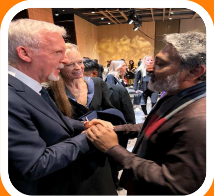
తీసుకెళ్లాలనే ప్రణాళికలతో 'వారణాసి' బృందం ఉంది. అందులో భాగంగానే ఇటీవల మెక్సికోలో జరిగిన కామిక్ కాన్ లో సినిమాని ప్రచారం చేశారు.

ప్రణాళికలు వేస్తున్నారు. వారణాసి' సినిమాతో మరెన్నో కొత్త మార్కెట్లను కొల్లగొట్టాలనే ప్రణాళికల్ని ఆ చిత్రబృందం సిద్ధం చేసింది. ముఖ్యంగా దక్షిణ అమెరికాతోపాటు, లాటిన్ అమెరికా దేశాల మార్కెట్లైన గురిపెట్టిన్ ట్యు తెలుస్తోంది. 'వారణాసి' కథ కూడా పలు దేశాల్లో ముడిపడినది కావడం, కథానాయకుడు ప్రపంచాన్ని చుట్టే సాహసీకుడు కావడంతో... మరెన్నో కొత్త దేశాలకు, కొత్త మార్కెట్ కి ఈ సినిమాని