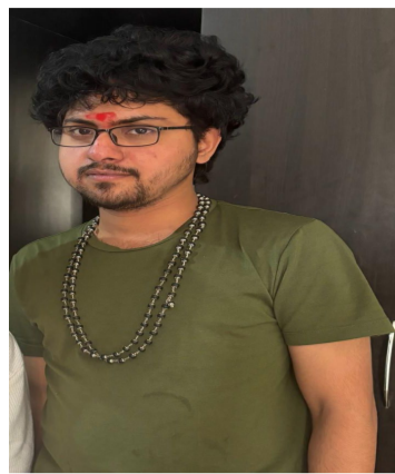
చెందినట్లు గుర్తించారు. పోలీసుల సహాయంతో మృతదేహాలను కారులో నుంచి బయటకు తీసి పోస్టుమార్టం నిమిత్తం ఉస్మానియా ఆసుపత్రికి