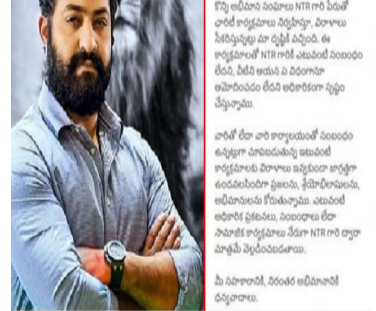
యంగ్ టైగర్ ఎన్టీఆర్ పేరును కొందరు దుర్వినియోగం చేస్తున్న వైనంపై ఆయన కార్యాలయం తీవ్రంగా స్పందించింది. సేవా కార్యక్రమాల పేరుతో కొన్ని అభిమాన సంఘాలు, వ్యక్తులు ప్రజల నుంచి విరాళాలు సేకరిస్తున్నట్లు తమ దృష్టికి వచ్చిందని, ఈ వ్యవహారంతో నటుడు ఎన్టీఆర్ కు గానీ, ఆయన అధికారిక కార్యాలయానికి గానీ ఎలాంటి సంబంధం లేదని స్పష్టం చేస్తూ ఓ కీలక ప్రకటన విడుదల చేసింది. సోషల్ మీడియా, వాట్సాప్ గ్రూపుల ద్వారా ఎన్టీఆర్ పేరును వాడుకుని డబ్బు వసూలు చేస్తున్నారని వస్తున్న సమాచారం నేపథ్యంలో ఈ హెచ్చరిక జారీ చేశారు. ఎన్టీఆర్ పై ఉన్న అభిమానాన్ని, ప్రజల నమ్మకాన్ని ఆసరాగా చేసుకుని కొందరు మోసాలకు పాల్పడే ప్రమాదం ఉందని ఆయన బృందం ఆందోళన వ్యక్తం చేసింది. ఎలాంటి అధికారిక అనుమతి లేకుండా ఎన్టీఆర్ పేరు, ఫోటోలు లేదా ఆయన ఫ్యాన్ బేస్ ను ఉపయోగించి నిర్వహిస్తున్న కార్యక్రమాలకు ఎవరూ విరాళాలు అందించి మోసపోవద్దని ప్రజలకు, ముఖ్యంగా అభిమానులకు విజ్ఞప్తి చేసింది. ఇలాంటి చర్యలు చట్టవిరుద్ధమని, వాటిని ప్రోత్సహించవద్దని కోరింది. భవిష్యత్ లో ఎన్టీఆర్ లేదా ఆయన కార్యాలయం ఆధ్వర్యంలో ఏదైనా సేవా కార్యక్రమం లేదా చారిటీ ఈవెంట్ నిర్వహించబడనీ, ఆ సమాచారాన్ని కేవలం ఎన్టీఆర్ అధికారిక సోషల్ మీడియా ఖాతాలు లేదా ఆయన కార్యాలయం ద్వారా మాత్రమే వెల్లడిస్తామని స్పష్టత ఇచ్చారు. అప్పటివరకు ఎవరైనా ఆయన పేరు చెప్పి విరాళాలు అడిగితే నమ్మవద్దని సూచించారు. నకిలీ విరాళాల సేకరణ ద్వారా మోసపోయే అవకాశం ఉన్నాయన అభిమానులు, ప్రజలు అత్యంత అప్రమత్తంగా ఉండాలని ఎన్టీఆర్ కార్యాలయం కోరింది. ఎక్కడైనా అనుమానాస్పదంగా విరాళాల సేకరణ జరుగుతున్నట్లు గమనిస్తే, వెంటనే స్థానిక అధికారులకు లేదా ఎన్టీఆర్ అధికారిక బృందానికి తెలియజేయాలని విజ్ఞప్తి చేసింది. ప్రస్తుతం ఎన్టీఆర్ పరచగా భారీ చిత్రాలతో కెరీర్ లో తీరిక లేకుండా ఉన్న సమయంలో ఆయన పేరును కొందరు స్వార్థానికి వాడుకోవడంపై అభిమానులు ఆగ్రహం వ్యక్తం చేస్తున్నారు. ఈ మోసాలపై ఒకరికొకరు అవగాహన కల్పించుకుంటూ సోషల్ మీడియాలో పోస్టులు పెడుతున్నారు.