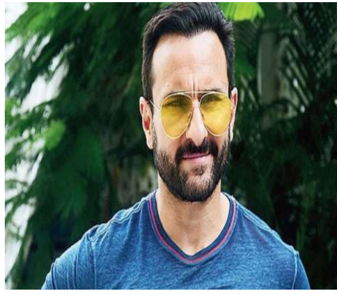
వృత్తి ధర్మానికి కట్టుబడాలా లేక కుటుంబాన్ని కాపాడుకోవాలా అనే సంఘర్షణ చుట్టూ ఈ కథ తిరుగుతుంది. ఈ చిత్రంలో సంజయ్ మిశ్రా, రసీక దుగ్గల్ వంటి ప్రముఖ నటులు కీలక పాత్రలు పోషించారు.

ఉందని హెచ్చరించారు. గతంలో తాను చేసిన వృత్తిపరమైన త్యాగాల వల్ల వ్యక్తిగతంగా ఎంతో నష్టపోయానని ఆయన ఆవేదన వ్యక్తం చేశారు. కరీనా కపూర్ తో వివాహం తర్వాత తైమూర్, జహంగీర్ పుట్టిన తర్వాత తనలో బాధ్యత పెరిగిందని సైఫ్ తెలిపారు. "ఈ వయసులో కుటుంబంతో గడవడం ఎంత ముఖ్యమో నాకు అర్థమైంది. ఉదయం 9 నుంచి రాత్రి 9 వరకు పనిచేసే పిల్లలు నన్ను ఇబ్బంది పెడుతున్నాయి. రాత్రి 11 గంటలకు ఇంటికి రావడం అనేది అసలు జీవితమే కాదు" అని ఆయన పేర్కొన్నారు. అందుకే 2022 నుంచి ఏడాదికి కేవలం ఒకే ఒక ప్రాజెక్ట్ చేస్తూ, మిగిలిన సమయాన్ని తన పిల్లలతో గడవడానికి ప్రాధాన్యత ఇస్తున్నట్లు వివరించారు. కాగా, 'కర్తవ్య' సినిమాలో సైఫ్ అలీ ఖాన్ ఒక పోలీస్ ఆఫీసర్ పాత్రలో కనిపిస్తారు. ఒక నేరాన్ని చేదించే క్రమంలో తన కుటుంబం ప్రమాదంలో పడితే, తన