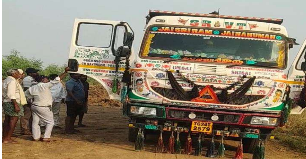
విమర్శలు వెల్లువెత్తుతున్నాయి. కొందరు గ్రామస్థులు డబ్బుల ఆశతో ఈ వ్యవహారానికి సహకరిస్తున్నారన్న ప్రచారం స్థానికంగా కలకలం రేపుతోంది. భారీ స్థాయిలో మట్టి తవ్వకాల వల్ల భూగర్భ జలాలపై ప్రభావం పడే ప్రమాదం ఉందని పర్యావరణ వర్గాలు హెచ్చరిస్తున్నాయి. వ్యవసాయ భూముల స్వరూపం మారిపోతుందన్న ఆందోళనలు కూడా వ్యక్తమవుతున్నాయి.

అర్బణపెల్లి ప్రాంతంలో నల్లమట్టి అక్రమ తవ్వకాల వ్యవహారం తీవ్ర చర్చనీయాంశంగా మారుతోంది. ప్రభుత్వ భూములు, శిఖం ప్రాంతాలపై కన్నేసిన మట్టి వ్యాపారులు అధికార పార్టీ అండదండలతో రెచ్చిపోతున్నారన్న ఆరోపణలు వినిపిస్తున్నాయి. అనుమతులు లేకుండానే భారీ స్థాయిలో మట్టిని తవ్వి తరలిస్తున్నప్పటికీ సంబంధిత శాఖలు మాత్రం మౌనంగా ఉండటం అనుమానాలకు తావిస్తోంది. ప్రత్యేకంగా ఇరిగేషన్, రెవెన్యూ శాఖలలోని కొందరు అధికారుల సహకారం లేకుండా ఈ స్థాయిలో అక్రమ తవ్వకాలు జరగడం సాధ్యం కాదని స్థానికులు ఆరోపిస్తున్నారు. రాత్రి వేళల్లో ట్రాక్టర్లు, టిప్పర్లు నిరంతరం తిరుగుతున్నప్పటికీ తనిఖీలు లేకపోవడం వెనుక కారణాలేమిటన్న ప్రశ్నలు తలెత్తిస్తున్నాయి. అర్బణపెల్లి శిఖం భూములు ప్రభుత్వ పరిరక్షణలో ఉన్నాడని ప్రాంతాలు. కానీ ఇప్పుడు అదే భూములు నల్లమట్టి దండాకు కేంద్రంగా మారుతున్నాయన్న విమర్శలు వెల్లువెత్తుతున్నాయి. కొందరు గ్రామస్థులు డబ్బుల ఆశతో ఈ వ్యవహారానికి సహకరిస్తున్నారన్న ప్రచారం స్థానికంగా కలకలం రేపుతోంది. భారీ స్థాయిలో మట్టి తవ్వకాల వల్ల భూగర్భ జలాలపై ప్రభావం పడే ప్రమాదం ఉందని పర్యావరణ వర్గాలు హెచ్చరిస్తున్నాయి. వ్యవసాయ భూముల స్వరూపం మారిపోతుందన్న ఆందోళనలు కూడా వ్యక్తమవుతున్నాయి.