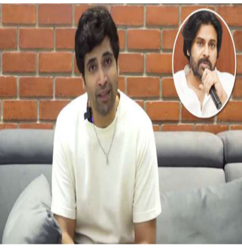
అసాధారణమైనవి" అని శేష్ కొనియాడారు. సామాన్యుల బాధలను విన్న వెంటనే వాటి పరిష్కారానికి స్పందించే తత్వం అందరు నాయకుల్లోనూ చూడలేమని, అది పవన్ కల్యాణ్ ప్రత్యేకత అని ఆయన స్పష్టం చేశారు. డిప్యూటీ సీఎంగా బాధ్యతలు చేపట్టినప్పటి నుంచి పవన్

ఏవీ డిప్యూటీ సీఎం, జనసేన అధినేత పవన్ కల్యాణ్ తనదైన పాలనా శైలితో రాజకీయ వర్గాల్లోనే కాకుండా, సాధారణ ప్రజల్లోనూ ప్రత్యేక గుర్తింపు తెచ్చుకుంటున్నారు. డిప్యూటీ సీఎంగా బాధ్యతలు స్వీకరించిన నాటి నుంచి క్షేత్రస్థాయి సమస్యలపై ఆయన చూపిస్తున్న చొరవ, తీసుకుంటున్న నిర్ణయాలు సర్వత్రా చర్చనీయాంశమవుతున్నాయి. ఈ నేపథ్యంలో, ఆయన నాయకత్వ పటిమపై టాలీవుడ్ విలక్షణ నటుడు అడివి శేష్ సోషల్ మీడియా వేదికగా ప్రశంసల వర్షం కురిపించారు. పవన్ కల్యాణ్ నిజమైన ప్రజా నాయకుడని కొనియాడారు. ప్రజల కష్టాలను విని వెంటనే స్పందించే గుణం నిజమైన నాయకుడికి ఉండాలని ప్రాథమిక లక్షణమని, ఆ లక్షణం పవన్ కల్యాణ్ లో పులుసుగా ఉందని అడివి శేష్ తన పోస్టులో పేర్కొన్నారు. "సమాజంలో మార్పు కోసం నిరంతరం తపించే పవన్ గారి పుష్కలతను ఎంతో స్పూర్తిగా చూడాలి. ప్రజలు ఎదుర్కొనే వివిధ సమస్యల పట్ల ఆయన చూపే నిబద్ధత, చొరవ నిజంగా