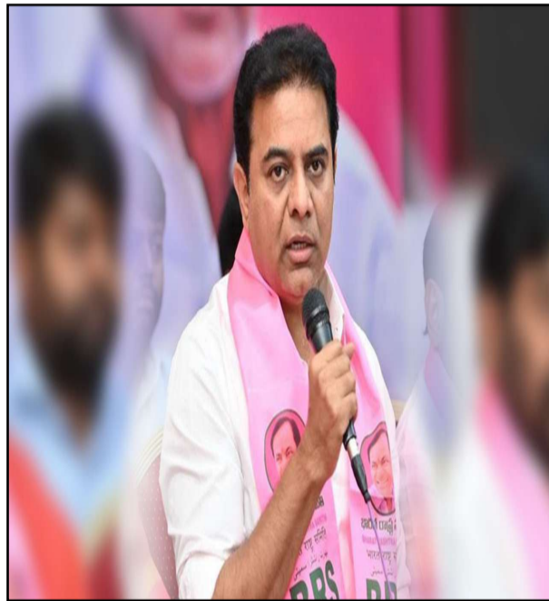
ఆరోపించారు. బాధితురాలి తల్లిదండ్రులను భయభ్రాంతులకు గురి చేసి కేసును నీరుగార్చాలని చూశారన్నారు. ఇలాంటి వ్యక్తులు ఉన్నతమైన పదవుల్లో కొనసాగడం తెలంగాణ రాష్ట్రానికే గాక దేశానికే అవమానమని మండిపడ్డారు.

బాలికకు న్యాయం జరిగేలా బీఆర్ఎస్ పార్టీ మాత్రమే పోరాడిందని తెలిపారు. గత రెండున్నరేళ్లుగా తెలంగాణలో శాంతిభద్రతలు పూర్తిగా దిగజారాయని ఆరోపించారు. ప్రధాని మోదీ చెబుతున్న 'బీటీ పదావో.. బీటీ బచావో' నినాదం కేవలం మాటలకే పరిమితమైందని విమర్శించారు. దేశ చరిత్రలో బహుశా మొదటిసారి ఓ కేంద్రమంత్రి కుమారుడిపై లుకొట్ సర్క్యులర్ ఇచ్చే పరిస్థితి వచ్చిందని కేటీఆర్ అన్నారు. బండి సంజయ్ కుమారుడు అరెస్టయిన నేపథ్యంలోనే కేటీఆర్ విమర్శలు చేశారు. తప్పు చేసిన వ్యక్తిని సరిగా జరగదని అనుమానం వ్యక్తం చేశారు. తప్పు చేసిన వ్యక్తిని దాచావు 9 రోజుల పాటు దాచిపెట్టింది కేంద్రమంత్రినని