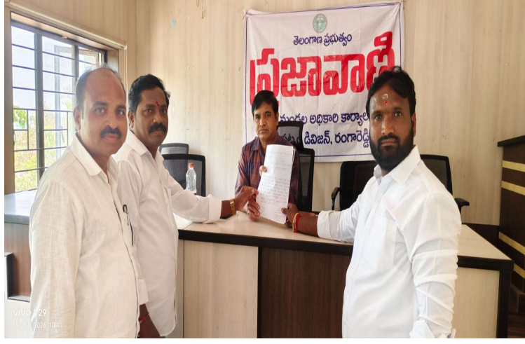
ట్రాన్స్మిషన్లు, లైన్ మరమ్మతులు చేపట్టి ప్రజలకు నాణ్యమైన విద్యుత్ సరఫరా అందేలా చర్యలు తీసుకోవాలని కోరారు. గ్రామ ప్రజల సమస్యలను గుర్తించి త్వరితగతిన పరిష్కారం చూపించాలని ప్రజలు అధికారులను విజ్ఞప్తి చేశారు.

హైదరాబాద్ ఎస్టేట్ ప్రతినిధి మే 18:- ఇబ్రహీంపట్నం మండల పరిధిలోని ఉప్పరిగూడ గ్రామంలో గత కొంతకాలంగా విద్యుత్ సరఫరా సక్రమంగా లేకపోవడంతో గ్రామ ప్రజలు తీవ్ర ఇబ్బందులు ఎదుర్కొంటున్నారు. ముఖ్యంగా తరచూ కరెంటు పోవడం, తక్కువ వోల్టేజీ రావడం వంటి సమస్యల కారణంగా ఇళ్లలో ఉపయోగించే ఫ్యాన్లు, ఫ్రిజ్లు, టీవీలు, మోటార్లు తదితర గృహోపకరణాలు దెబ్బతింటున్నాయని గ్రామస్థులు ఆవేదన వ్యక్తం చేస్తున్నారు. సాయంత్రం మరియు రాత్రి సమయాల్లో వోల్టేజీ సమస్య మరింత అధికమవడంతో చిన్నపిల్లలు, వృద్ధులు, విద్యార్థులు ఇబ్బందులు పడుతున్నారని తెలిపారు. ఈ సమస్య కారణంగా గ్రామ ప్రజల దైనందిన జీవనం అస్తవ్యస్తంగా మారిందని, వ్యవసాయ పనులు మరియు ఇతర అవసరాలపై కూడా ప్రభావం పడుతోందని గ్రామస్థులు పేర్కొన్నారు. ఎన్నిసార్లు సంబంధిత అధికారుల దృష్టికి తీసుకెళ్లినా సమస్యకు శాశ్వత పరిష్కారం లభించలేదని ఆగ్రహం వ్యక్తం చేశారు.ఈ నేపథ్యంలో ఉప్పరిగూడ గ్రామ ప్రజలు ఈరోజు ఇబ్రహీంపట్నం ఎంపీడివో కార్యాలయంలో నిర్వహించిన ప్రజావాణి కార్యక్రమంలో పాల్గొని అధికారులకు వినతిపత్రం సమర్పించారు. గ్రామంలో ఉన్న విద్యుత్ మరియు వోల్టేజీ సమస్యలను తక్షణమే పరిశీలించి అవసరమైన