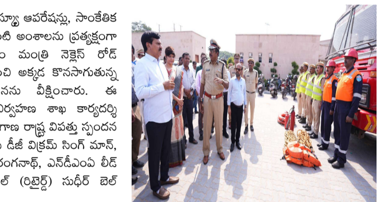
శాఖలకు చెందిన ఆధికారులు, సిబ్బంది పెద్ద ఎత్తున హాజరై విపత్తు సమయంలో సమన్వయంతో పనిచేసే విధానాలను ప్రదర్శించారు.

హైదరాబాద్ ఎస్టేట్ ప్రతినిధి మే 18:- హైదరాబాద్ నగరంలోని నెక్లెస్ రోడ్ హెచ్ఎంఓవీ గ్రౌండ్స్ లో రాష్ట్ర విపత్తు నిర్వహణ కార్యక్రమాల భాగంగా నిర్వహించిన భారీ వరదల మార్క్ డ్రీల్ లో రాష్ట్ర రెవెన్యూ, హౌసింగ్, సమాచార మరియు పౌర సంబంధాల శాఖ మంత్రి పొంగలలేటి శ్రీనివాసరెడ్డి ముఖ్య అతిథిగా పాల్గొన్నారు. ఈ కార్యక్రమంలో వివిధ శాఖల ఉన్నతాధికారులతో కలిసి మంత్రి అత్యవసర పరిస్థితుల్లో చేపట్టాల్సిన రక్షణ చర్యలను పరిశీలించారు. మార్క్ డ్రీల్ సందర్భంగా వరదల కారణంగా నీటిలో చిక్కుకున్న ప్రజలను సురక్షిత ప్రాంతాలకు తరలించే విధానాలను ప్రత్యేక బృందాలు ప్రదర్శించాయి. గాలితో నింపే లైఫ్ బోట్లు వినియోగం, అత్యవసర సహాయక చర్యలు,