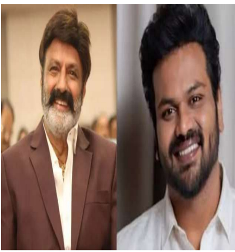
నిజమవుతోందని రాసుకొచ్చారు. భవిష్యత్తులో ఎన్ని సినిమాలు చేసినా బాలయ్య అన్నతో, గోపీచంద్ మలినేని గారితో ఉన్న అనుబంధం వల్ల ఈ సినిమా తన హృదయంలో ఎప్పటికీ ప్రత్యేకంగా

నందమూరి బాలకృష్ణ, సక్సెస్ ఫుల్ డైరెక్టర్ గోపీచంద్ మలినేని కాంట్రీవేషన్ లో తెరకెక్కుతున్న చిత్రం 'వీడియో-111' నుంచి టాలీవుడ్ ను ఊపేసే ఒక సెన్సేషనల్ అప్డేట్ బయటకు వచ్చింది. గతంలో వీరి కలయికలో వచ్చిన 'వీరసింహారెడ్డి' బాక్సాఫీస్ వద్ద భారీ విజయాన్ని అందుకోవడంతో ఈ కొత్త ప్రాజెక్ట్ పై ఇప్పటికే అంచనాలు ఆకాశాన్ని తాకుతున్నాయి. ఈ సినిమా మాటింగ్ శరవేగంగా జరుగుతోంది. మరోవైపు, నటుడు మంచు మనోజ్ పుట్టినరోజు సందర్భంగా ఆయన్ను ఈ ప్రాజెక్ట్ లోకి ఆహ్వానిస్తూ చిత్ర బృందం అధికారిక ప్రకటన విడుదల చేసింది. ఈ క్రేజీ ప్రాజెక్ట్ లో భాగమవడంపై మంచు మనోజ్ సోషల్ మీడియా వేదికగా స్పందిస్తూ తీవ్ర భావోద్వేగానికి లోనయ్యారు. తన జీవితంలో ఎంతో ఆశగా కోరుకున్న అత్యంత ప్రత్యేకమైన బహుమతి ఈ పుట్టినరోజున లభించిందని, తన గాడ్ ఫాదర్, లయన్ నందమూరి బాలకృష్ణతో కలిసి నటించాలనే ఎన్నో ఏళ్ల నిరీక్షణ, కల ఈ సినిమాతో