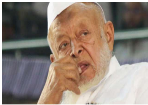
జంతువుగా ప్రకటిస్తే మత విద్వేష సమస్యకు శాశ్వత పరిష్కారం లభిస్తుందని అన్నారు. ఇందు కోసం అన్ని రాష్ట్రాల్లో ఒకే విధమైన చట్టం ఉండాలని అన్నారు.

ప్రకటించకుండా కేంద్ర ప్రభుత్వాన్ని ఎవరూ అడ్డుకుంటున్నారని ఆయన ప్రశ్నించారు. దేశంలోని మెజారిటీ వర్గం అవును పవిత్ర జంతువుగా మాత్రమే కాకుండా, తల్లిగా కూడా భావిస్తుందని తెలిపారు. అవు పేరుతో జరిగే రాజకీయ ఆట ఇకనైనా అంతం కావాలని ఆకాంక్షించారు. మతం పేరుతో జరిగే రాజకీయాల వల్ల ఎవరి ప్రాణాలు పోకూడదని అన్నారు. దేశంలో మత విభజన, విద్వేష రాజకీయాలకు శాశ్వత పరిష్కారం కావాలని అన్నారు. గోమాంసం విషయంలో వివిధ రాష్ట్రాలలో వివిధ చట్టాలు ఉన్నాయని గుర్తు చేశారు. మతవిద్వేషంతో కూడిన దాడులు భక్తి అనబడదని, రాజకీయ కుతంత్రాలు అన్నారు. గోవును జాతీయ