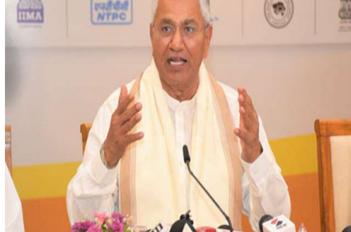
కాదని మాజీ ప్రధాన న్యాయమూర్తులు, సీనియర్ న్యాయ నిపుణులు అభిప్రాయపడినట్లు చౌదరి తెలిపారు. దేశవ్యాప్తంగా విస్తృత సంప్రదింపుల తర్వాత 18,000 పేజీలకు పైగా నివేదికను సిద్ధం చేస్తున్నామని, పార్టీ రాజకీయాలకు అతీతంగా జాతీయ ప్రయోజనాలే లక్ష్యంగా ఈ ప్రయత్నం చేస్తున్నామని ఆయన స్పష్టం చేశారు.

అసెంబ్లీలు ముందుగా రద్దు కావడంతో ఈ క్రమం తప్పిందని గుర్తుచేశారు. లోక్ సభ, అసెంబ్లీ ఎన్నికలను ఒకేసారి నిర్వహించి, ఆ తర్వాత 100 రోజుల్లోగా వచాయతీ, మున్సిపాలిటీ ఎన్నికలను పూర్తి చేయాలని తమ కమిటీ సిఫార్సు చేస్తోందని వివరించారు. తరచూ ఎన్నికల వల్ల ప్రభుత్వ అధికారులు, ఉపాధ్యాయులను ఎన్నికల విధులకు కేటాయింపాల్సి వస్తోందని, దీనివల్ల పాలనాపరమైన పనులు, విద్యార్థుల చదువులు దెబ్బతింటున్నాయని ఆవేదన వ్యక్తం చేశారు. పర్యాటకంపై ఆధారపడిన ఉత్పాదక వంటి రాష్ట్రాల ఆర్థిక వ్యవస్థ ఎన్నికల వల్ల నష్టపోతోందని పేర్కొన్నారు. జమిలి ఎన్నికల ప్రతిపాదన రాజ్యాంగ మౌలిక సర్వూపానికి గానీ, సమాఖ్య వ్యవస్థకు గానీ విరుద్ధం