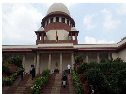
తప్పుదోవ పట్టించేలా ఉండటం కేంద్రం, రాష్ట్రాల్లోని ఎక్సైజ్ విభాగాలకు నోటీసులు జారీ చేసింది.