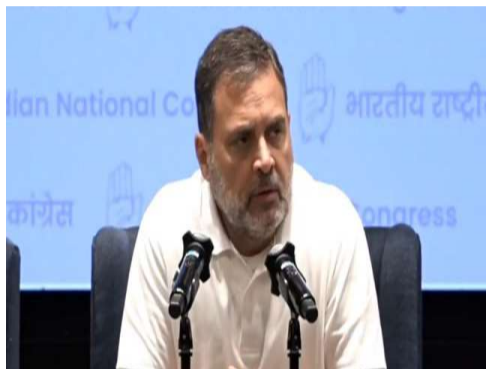
అవమానించడం అతడికి అలవాటుగా మారిందని అన్నారు. రాహుల్ గాంధీ భాష పాకిస్తాన్ నాయకులూ ఉందని కేంద్రమంత్రి గిరిరాజ్ సింగ్ అన్నారు. భారతదేశ ఆర్థిక వ్యవస్థ గురించి ప్రపంచానికి తెలుసని, రాహుల్ గాంధీ సుంచి ప్రశంసలు అవసరం లేదని విమర్శించారు. దేశంలో ఆశాంతిని రగుల్చాలని రాహుల్ గాంధీ కోరుకుంటున్నారని అన్నారు. కానీ మోదీ, అమిత్ షాలకు ప్రజలు