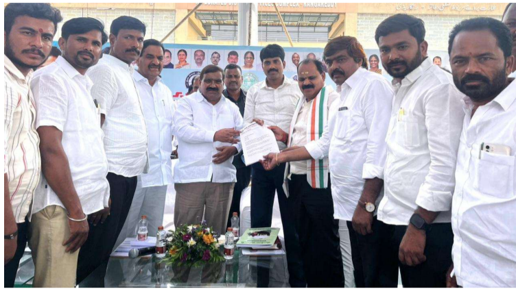
వ్యక్తమవుతోంది. ప్రజల అభిప్రాయానికి విరుద్ధంగా ఏ నిర్ణయం తీసుకోరాదని, వెంటనే ఈ ప్రతిపాదనను వెనక్కి తీసుకోవాలని ప్రజాప్రతినిధులు ఏకగ్రీవంగా డిమాండ్ చేశారు.