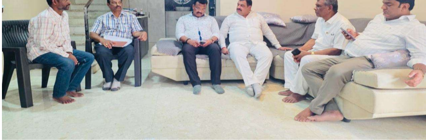
హైదరాబాద్ ఎస్టేట్ ప్రతినిధి మే 22:- ఎల్సీనగర్, ఇబ్రహీంపట్నం నియోజకవర్గాల్లో నిర్మాణంలో ఉన్న హ్యమ్ రోడ్లు పూర్తయితే ఈ ప్రాంతాల అభివృద్ధికి కొత్త ఊపు వస్తుందని తెలంగాణ రాష్ట్ర రోడ్ డెవలప్ మెంట్ కార్పొరేషన్ చైర్మన్ మల్లెరెడ్డి రాంరెడ్డి తెలిపారు. పెద్ద అంబర్ పేట్ నుంచి ముసగనూరు వరకు నిర్మిస్తున్న నాలుగు లేన్ల రహదారి పనులను ఈఎన్సీ మోహన్ నాయక్ తో కలిసి ఆయన పరిశీలించారు. ఈ సందర్భంగా మాట్లాడుతూ, ఎన్నో సంవత్సరాలుగా ప్రజలు ఎదుర్కొంటున్న ట్రాఫిక్ ఇబ్బందులకు ఈ రహదారులు శాశ్వత పరిష్కారంగా నిలుస్తాయని పేర్కొన్నారు. ప్రజా ప్రభుత్వ హయాంలో రోడ్ల అభివృద్ధి పనులు వేగంగా కొనసాగుతున్నాయని తెలిపారు. స్థానిక ప్రజల రాకపోకలకు ఎదురవుతున్న ఇబ్బందులు తన దృష్టికి వచ్చాయని, మంత్రి కోమటిరెడ్డి వెంకటరెడ్డి సహకారంతో పాటు ఎమ్మెల్యే మల్లెరెడ్డి రాంరెడ్డితో సమన్వయం చేసుకుంటూ రహదారుల అభివృద్ధిపై ప్రత్యేక దృష్టి సారించుతున్నామని చెప్పారు. నిర్మాణ పనులను త్వరితగతిన పూర్తి చేసి ప్రజలకు అందుబాటులోకి తీసుకురావడానికి చర్యలు కొనసాగుతున్నాయని వెల్లడించారు. ఈ కార్యక్రమంలో స్థానిక ప్రజాప్రతినిధులు, అధికారులు, నాయకులు పాల్గొన్నారు.

నాలుగు లేన్ల రహదారులతో మారనున్న ఎల్సీనగర్, ఇబ్రహీంపట్నం రూపురేఖలు