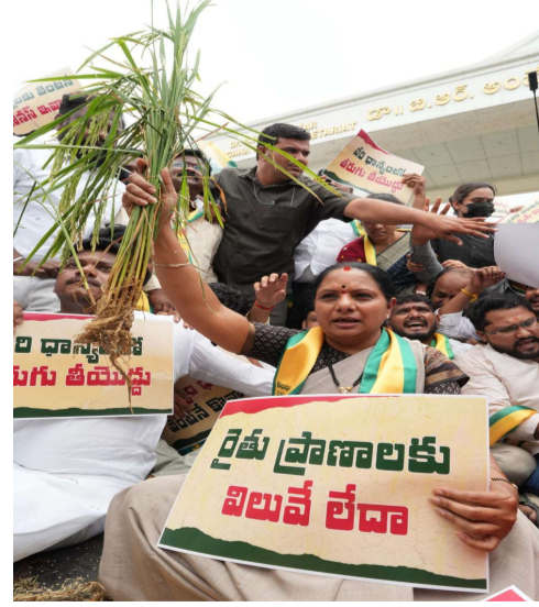
రైతులు ఇబ్బందులు పడుతున్నారని, ప్రభుత్వం తీసుకొచ్చిన యాక్ రైతులకు అర్థం కావడం లేదని అన్నారు. రైతులకు ఎలాంటి ఇబ్బందులు లేకుండా ప్రభుత్వం తక్షణ చర్యలు తీసుకోవాలని ఆమె డిమాండ్ చేశారు.