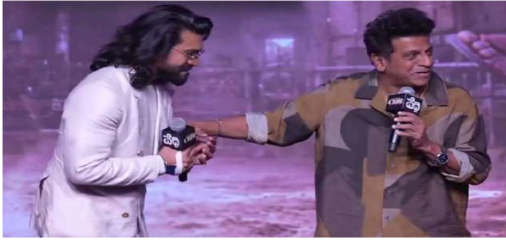
కష్టం, ఆయన నటనకు హ్యూటన్స్ చెప్పాల్సిందే" అని ప్రశంసించారు.