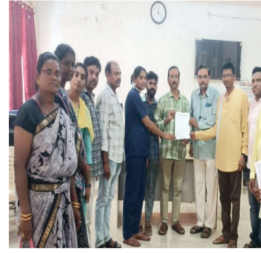
అసంతృప్తి వ్యక్తం చేశారు. ఉద్యోగులు ప్రధానంగా హెచ్ఆర్ విధాన అమలుకు ప్రత్యేక సెలను ఏర్పాటు చేయాలని, ఉద్యోగులను క్రమబద్ధీకరించాలని డిమాండ్ చేశారు. అదనంగా పదవీ విరమణ పంపిణీను 62 సంవత్సరాలకు పెంచడం, సర్టిఫైడ్ మెంటోరీ కల్పించడం, ప్రభుత్వ సంక్షేమ పథకాలను అందరికీ వర్తింపజేయాలని డిమాండ్ చేశారు. కాంట్రాక్ట్ ఔట్సోర్సింగ్, ఎన్.ఎం.ఆర్, డైలీ వేజ్, కంజంటంట్ ఉద్యోగుల సమస్యలను తక్షణ