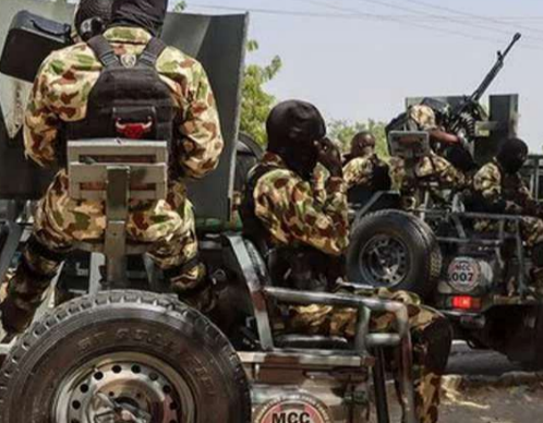
దాంగతనాలు విపరీతంగా పెరిగిపోయినట్లు అధికారులు చెప్పారు.

వ్యతిరేక ఆపరేషన్ లో పాల్గొన్నట్లు ఓంజా తెలిపారు. ఉగ్రవాదుల నుంచి 93 ఆయుధాలను స్వాధీనం చేసుకున్నట్లు చెప్పారు. అక్రమంగా నిర్వహిస్తున్న మూడు అయిల్ రిఫైనరీ కేంద్రాలను ధ్వంసం చేసినట్లు చెప్పారు. వేల వేల లీటర్ల పెట్రోల్ ఉత్పత్తులను సీజ్ చేశారు. వశ్యమ అక్రమ దేశమైన నైజీరియాలో ఉగ్రవాదం, దాంగతనాలు విపరీతంగా పెరిగిపోయినట్లు అధికారులు చెప్పారు.