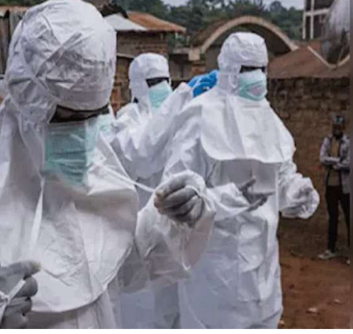
లక్షణాలు ఎబోలాకు సంబంధించినవేనా.. కాదా..? అనే విషయంపై ముందుగానే స్పష్టత ఇవ్వలేమని చెప్పారు.