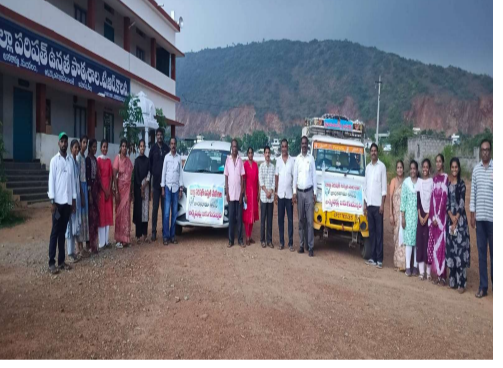
హాంక గ్రామస్థులు, తమ సహాయ సహకారాలి అందిస్తూ స్వయంగా ఇంటింటికి ప్రచారం చేయడం జరుగుతుంది గ్రామస్థుల నుంచి విశేషమైన సహాయ సహకారాలు అందుతున్నాయి ఈ కార్యక్రమాన్ని చక్కగా నిర్వహిస్తున్నారని ప్రశంసిస్తున్నారు.