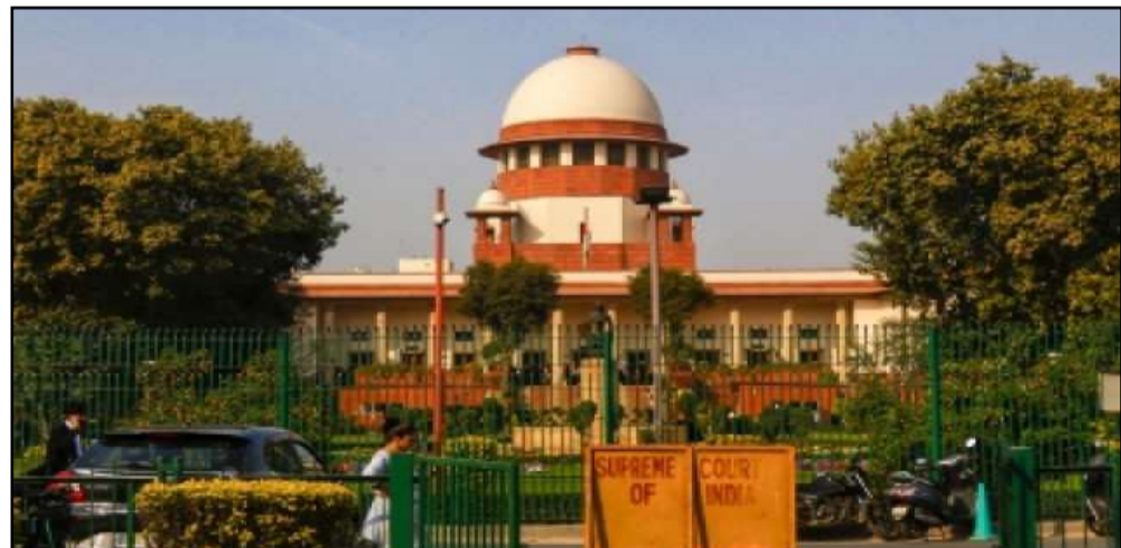
జాబితాను కేంద్ర న్యాయ మంత్రిత్వ శాఖ పరిశీలించి, నూతన న్యాయమూర్తులుగా వీరు ప్రమాణ స్వీకారం చేస్తారు. కేబినెట్ ఆమోదం కోసం పంపుతుంది. కేంద్ర కేబినెట్ ఆమోదం అనంతరం, ఈ నియామకాలతో సుప్రీంకోర్టులో న్యాయమూర్తుల సంఖ్య పెరిగి, కార్యకలాపాలు మరింత చురుగ్గా సాగే అవకాశం ఉంది.