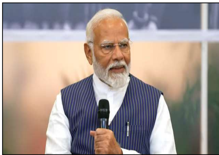
కొనియాడారు. ఎన్టీఆర్ జీవితం ఎంతో మంచికి స్ఫూర్తిదాయకమని అన్నారు. పేదల కోసం ఎన్టీఆర్ కన్న కలలను సాకారం చేయడానికి ఎన్టీయే ప్రభుత్వం కట్టుబడి ఉందని చెప్పారు.

విశ్వ విఖ్యాత నట సార్వభౌముడు, తెలుగుదేశం పార్టీ వ్యవస్థాపకుడు, దివంగత సీఎం ఎన్టీఆర్ జయంతి సందర్భంగా ప్రధాని మోదీ నివాళి అర్పించారు. పేద, అణగారిన వర్గాలకు గౌరవం తీసుకురావడమే లక్ష్యంగా ఎన్టీఆర్ పని చేశారని కితాబునిచ్చారు. ప్రజా సంక్షేమం, సుపరిపాలన పట్ల ఆయనకున్న అంకితభావం పేదల హృదయాల్లో శాశ్వతంగా నిలిచిపోయిందని అన్నారు. చిత్ర పరిశ్రమకు ఎన్టీఆర్ అందించిన సేవలు ఎప్పటికీ గుర్తుంటాయని మోదీ