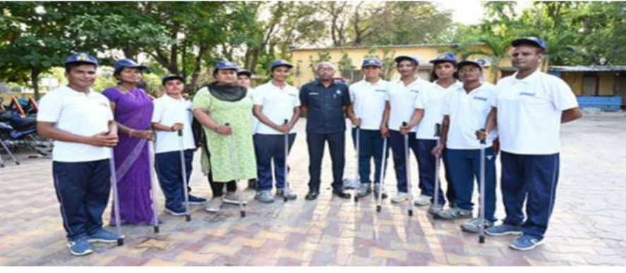
హైద్రాబాద్ 16 మంది ట్రాన్స్ జెండర్లకు ఉద్యోగాలు...