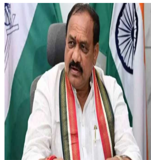
మానుకోవాలని సూచించారు. ప్రతి ఓటును కాపాడుకోవాలని బాధ్యత మనపై ఉందని చెప్పారు.