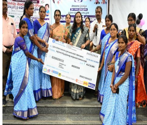
సంబంధించిన ఆరు ముఖ్య అంశాలపై అవగాహన కల్పించారు. ఆరోగ్యం, పోషణ, తక్షణ సంరక్షణ, ప్రారంభ ప్రేరణ వంటి అంశాలపై ప్రత్యేకంగా వివరించారు. కార్యక్రమంలో భాగంగా ఇంటి వద్ద లభించే వ్యర్థ పదార్థాలతో పిల్లల అభివృద్ధికి ఉపయోగపడే లోకాస్ట్ ఆటోమ్యూల తయారీ పోటీలు నిర్వహించారు. వివిధ ప్రాజెక్టులు నుంచి వచ్చిన అంగన్వాడీ కార్యకర్తలు, తల్లిదండ్రులు తయారు