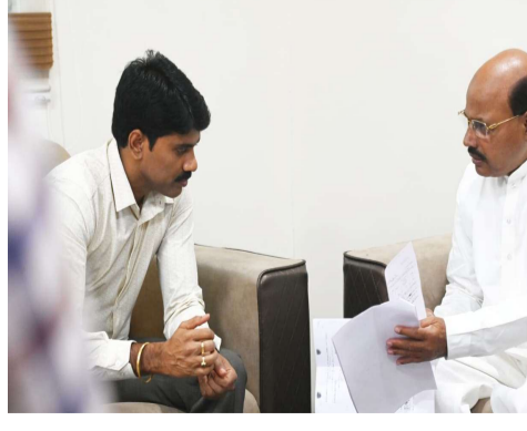
ప్రభుత్వాన్ని హెచ్చరించారు. రైతుల సమస్యలపై జిల్లా కలెక్టర్ సానుకూలంగా స్పందించి, అంశాన్ని పరిశీలిస్తామని హామీ ఇచ్చినట్లు తెలిపారు.

మార్కెట్ కోసం ఇప్పటికే భూమి కేటాయించినప్పటికీ, ఇప్పుడు కొత్తగా సాగుభూములను ఎంపిక చేయడం రైతులకు ఇబ్బందిగా మారిందన్నారు. వ్యవసాయమే ఆధారంగా జీవనం సాగిస్తున్న రైతుల పరిస్థితిని ప్రభుత్వం గుర్తించి, వారికి తగిన సహకారం మరియు భరోసా కల్పించాలని కోరారు. రైతుల ప్రయోజనాలను దృష్టిలో పెట్టుకుని సరైన నిర్ణయం తీసుకోవాలని కలెక్టర్ను విజ్ఞప్తి చేశారు. వచ్చే నెల 3న పూట్ మార్కెట్ శంకుస్థాపన కార్యక్రమం నిర్వహించే అవకాశం ఉన్నందున, అంతకుముందే రైతుల సమస్యలపై ప్రభుత్వం స్పష్టమైన నిర్ణయం తీసుకోవాలని డిమాండ్ చేశారు. తమ సమస్యలను చెప్పుకుంటున్న రైతులపై ఒత్తిళ్లు, బెదిరింపులు లేదా కేసులు నమోదు చేసే చర్యలకు దూరంగా ఉండాలని