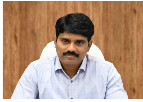
అదేశించారు. కార్యక్రమ వేదికను పూలతో అందంగా అలంకరించాలని ఉద్యానవన శాఖ అధికారికి సూచించారు. అమరవీరుల స్మారకం వద్ద ప్రత్యేక ఏర్పాట్లు చేయడంతో పాటు వివిధ శాఖలకు సంబంధించిన ప్రదర్శన స్లాట్ల ఏర్పాటు చేసి ప్రభుత్వ పథకాల ప్రగతిని ప్రజలకు వివరించేలా చర్యలు తీసుకోవాలని సంబంధిత అధికారులకు దిశానిర్దేశం చేశారు.