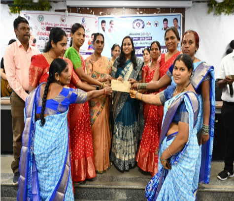
చేసిన విద్యా సామగ్రి, ఆటోమ్యూలను ప్రదర్శించారు. వినూత్నంగా రూపొందించిన ఆటోమ్యూలకు అదనపు కలెక్టర్ బహుమతులు అందజేసి అభినందించారు. ఈ కార్యక్రమంలో సీడీపీఓలు, సూపర్వైజర్లు, అంగన్వాడీ కార్యకర్తలు, గర్భిణీలు, బాలింతలు, తల్లిదండ్రులు, జిల్లా మహిళా మరియు శిశు సంక్షేమ శాఖ సిబ్బంది, ప్రధమ్ ఫౌండేషన్ ప్రతినిధులు పాల్గొన్నారు.