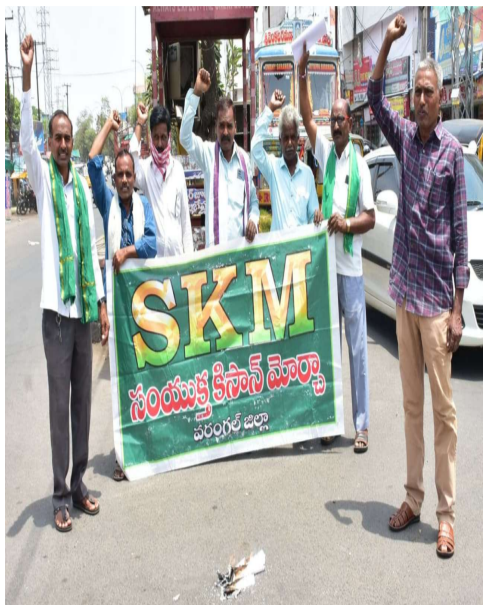
ధరలు ప్రకటించింది వారు విమర్శించారు. రోజురోజుకూ విత్తనాలు రసాయనిక ఎరువులు పురుగుమందులు డీజిల్ సాగునీరు విద్యుత్ ధరలు

12 సంవత్సరాల మోడీ ప్రభుత్వం తాము అధికారంలోకి వస్తే స్వామినాథన్ సిఫార్సుల అనుగుణంగా కనీస మద్దతు ధరలు అమలు చేస్తామని ప్రకటించి ఈరోజు నామమాత్రపు మద్దతు